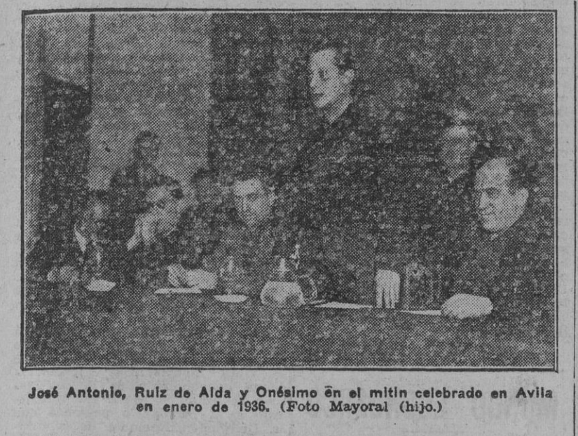
José Antonio, Ruiz de Alda y Onésimo en el mitin celebrado en Avila en enero de 1936.

VALLADOLID, 13.—La ciudad ofrece desde anoche un aspecto que revela la magnitud de los actos proyectados. Es enorme la cantidad de camaradas que llegan de todas las provincias de España y, en especial, de las de Castilla y León. Las calles de la capital están totalmente engalanadas para destacar el cariño espiritual hacia el fundador de las J. O. N. S. castellanas, y aquellas por las que han de desfilar las manifestaciones oficiales, con mayor esplendor. Por la mañana se concentraron en el paseo de las Moreras millares de camaradas de Camisas Viejas de toda España, con objeto de recibir consignas sobre los actos que se celebrarán. Después se desfilaron por las principales calles de la ciudad, con banderas y uniformes de gala, las centurias de Madrid, seguidas de las Milicias Universitarias de la misma capital, que llamaron la atención por su marcialidad y atuendo.