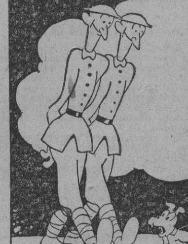
SOLDADOS GIGANTES, por Bellón.