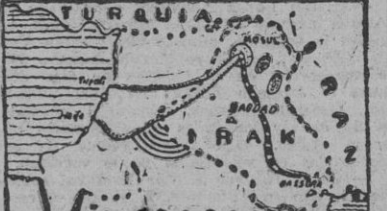
En el grabado se aprecian las tres principales zonas petrolíferas de Mosul y los dos oleoductos. La zona rayada con arcos de círculo sitúa aproximadamente la región por la que los árabes pasan para hacer causa común con los iraquíes.

VICHY, 17. (S. E. T.).—Oficialmente comunican desde Bagdad que las fuerzas mandadas por el jefe del levantamiento de Palestina, Fawzi Kaukji, han conseguido romper las líneas inglesas en el desierto y avanzar hacia las alturas de Nablo. Numerosos voluntarios de Palestina se alistaron en el ejército de Kaukji. (Efe.)