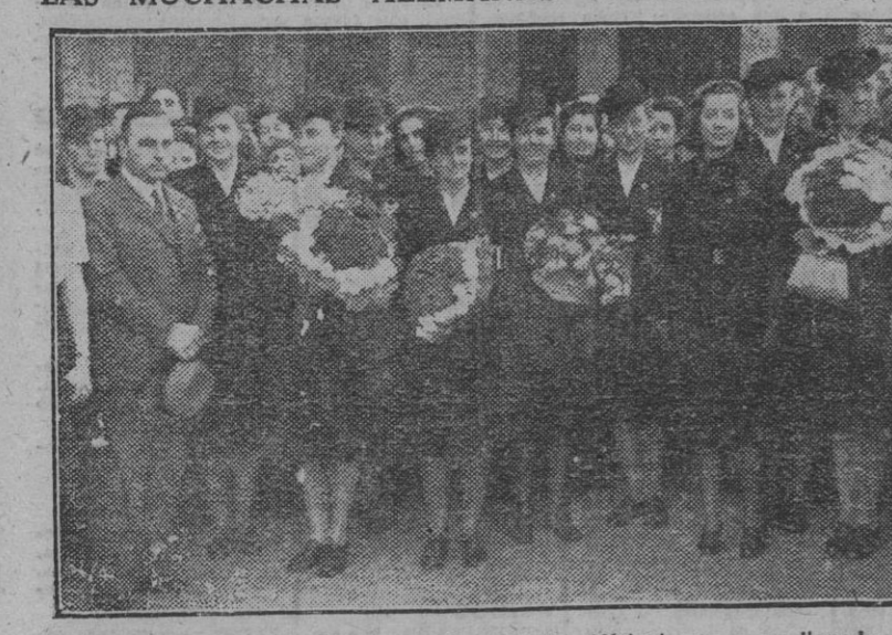
Las muchachas del Frente de Juventudes Hitlerianas a su llegada a la capital levantina.