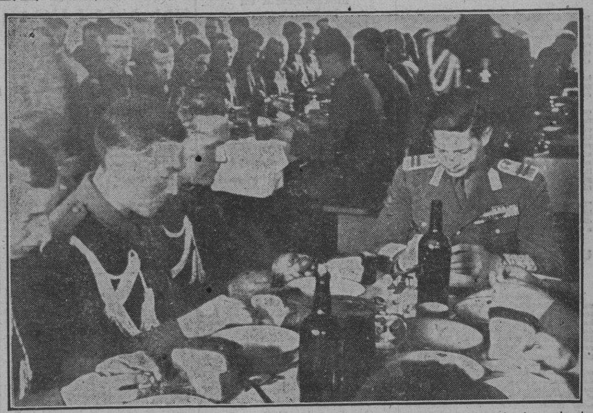
El Rey Miguel de Rumania almuerza con sus soldados el día de la Fiesta de la Independencia nacional.