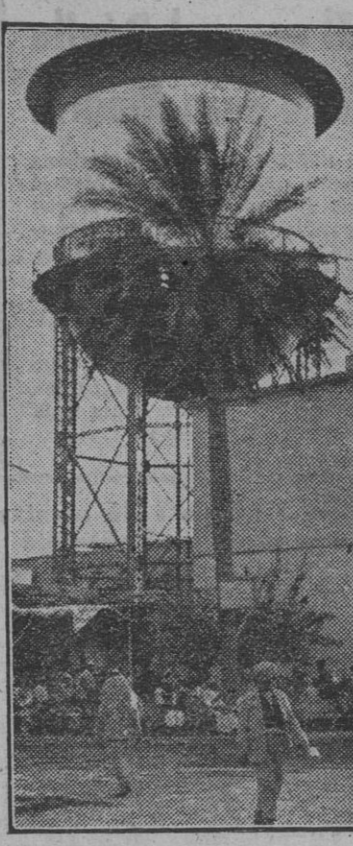
Bagdad, la bella ciudad de los cuentos fantásticos, carece de surtidores de agua propios. En estos grandes depósitos se almacena el precioso líquido para surtirlo a los habitantes de la antigua capital árabe.