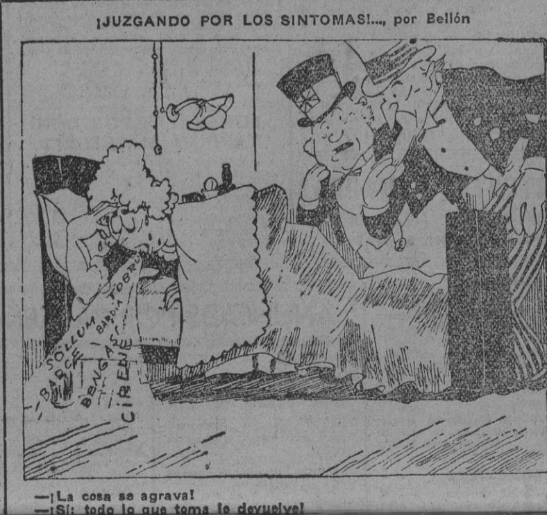
—La cosa se agrava —Si todo lo que toma le devuelve