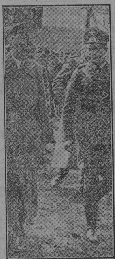
El Führer-Canciller, acompañado por Von Brauchitsch, gira una visita de inspección a los puestos de mando del frente de batalla antes de comenzar las operaciones. (Foto Weiblich.)

de bombardeo realizaron un audaz ataque contra la industria aérea inglesa de Manchester. Se arrojaron gran número de bombas de gran calibre, que alcanzaron la zona de montaje, ocasionando graves daños a destrucciones, lo que representa una señalada disminución de la producción aérea enemiga. (Efe.)