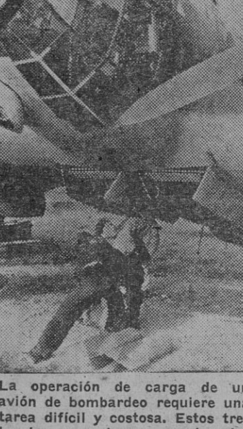
La operación de carga de un avión de bombardeo requiere una tarea difícil y costosa. Estos tres hombres consiguen acoplar las cargas...