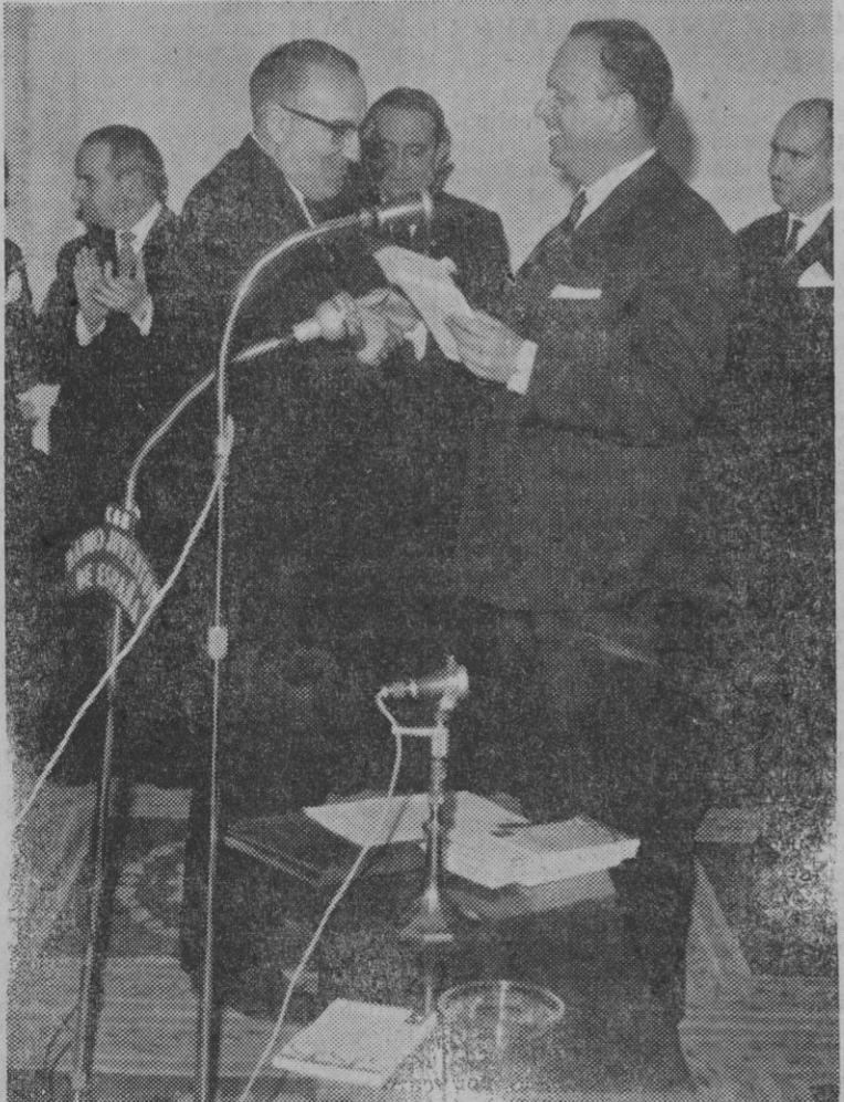
PREMIOS XXV AÑOS DE PAZ

Los propietarios de automóviles corren el peligro, si los dejan en la calle, de encontrarse con una desagradable sorpresa. Los descuidados, sobre todo, los sábados.