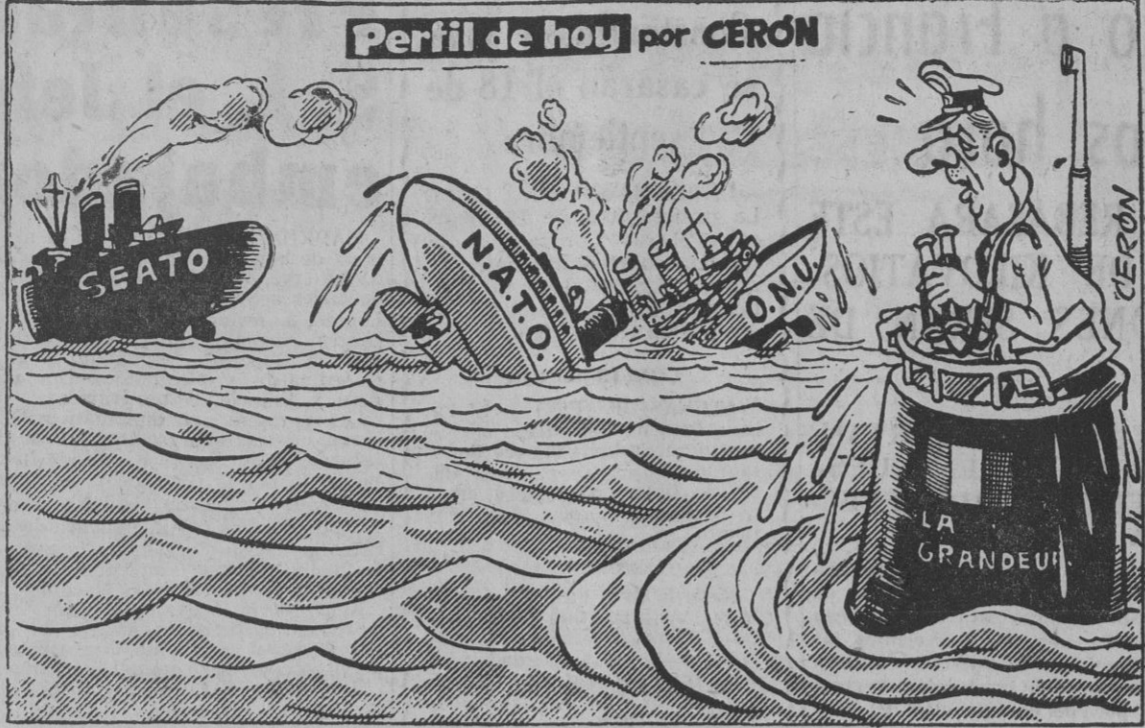
DE GAULLE. — Pero aún siguen a flote?...