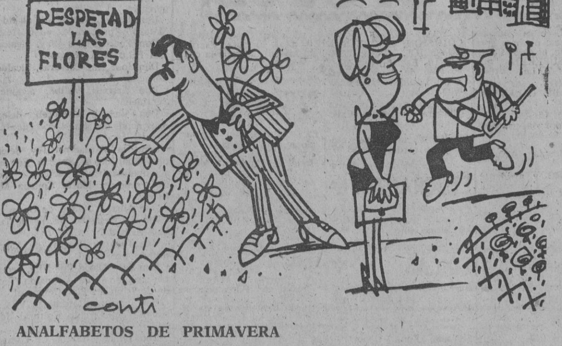
ANALFABETOS DE PRIMAVERA