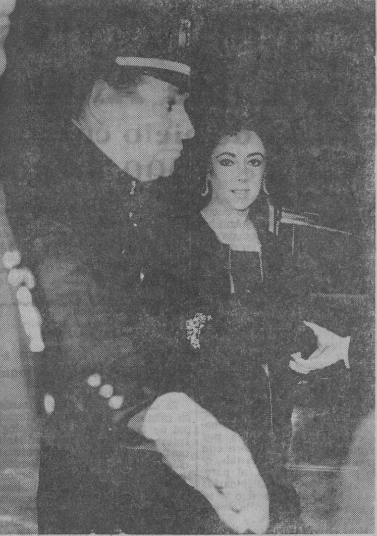
LIZ TAYLOR EN EL ESTRENO DE "HAMLET" Momento de la llegada de la actriz Liz Taylor al estreno de "Hamlet" en el teatro Lunt Fontanne en Broadway. El protagonista de dicha obra es el actor Richard Burton, quinto marido de la actriz.