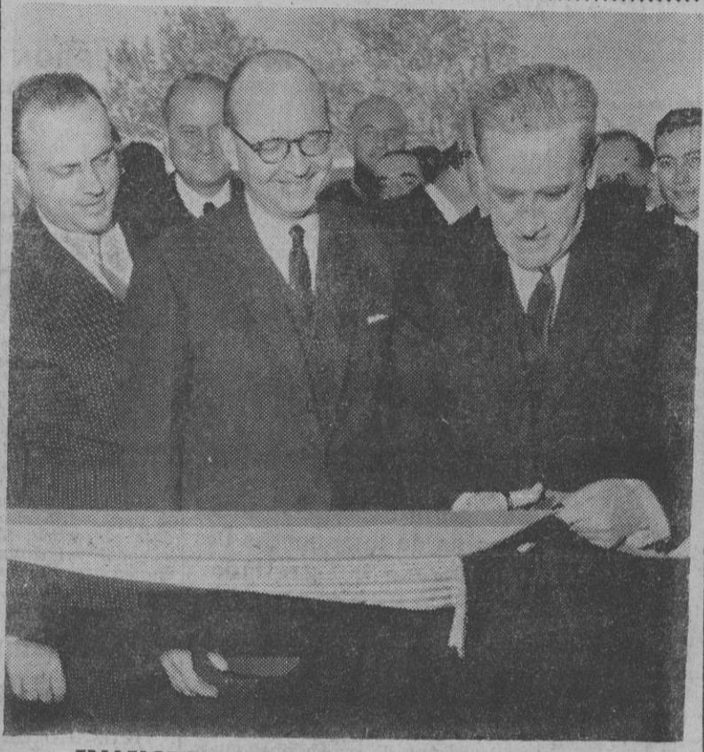
INAUGURACION DE LA EXPOSICION "ATOMOS EN ACCION" MADRID. — Un momento del acto inaugural de la Exposición "Átomos en acción", presentada por la Comisión de Energía Atómica de los Estados Unidos, en colaboración con la Junta de Energía Nuclear. Asistieron al acto el vicepresidente del Gobierno, capitán general Muñoz Grandes, acompañado del ministro de Asuntos Exteriores, Información y Turismo e Industria. En dicho acto el embajador de los Estados Unidos, Mr. Woodward, pronunció un discurso, y el vicepresidente, Muñoz Grandes, cortó la cinta simbólica de acceso a dicha Exposición.

MANILA, 16 (Efe).—Dean Rusk, secretario norteamericano de Estado, ha salido de esta capital, en avión militar norteamericano para trasladarse a Saigón, vía Formosa; en Saigón, estudiará, con el general Nguyen Jan, jefe del Gobierno del Vietnam del Sur, la situación militar en el país a la luz de los resultados de la conferencia de Ministros de la SEATO, que se ha celebrado en la capital filipina. Rusk pasará dos días en Saigón antes de emprender viaje de regreso a Washington.