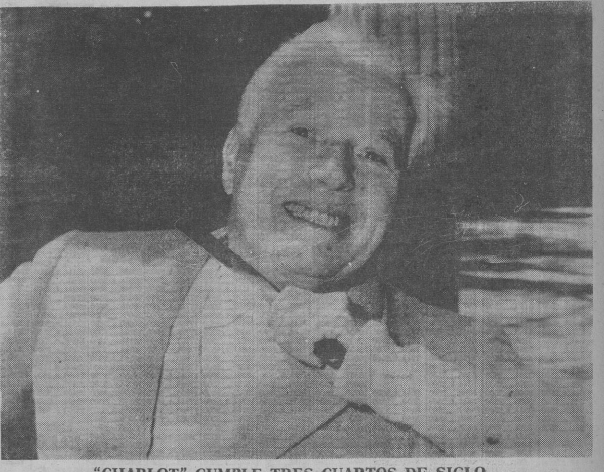
"CHARLOT" CUMPLE TRES CUARTOS DE SIGLO Hoy, 16 de abril, Charlie Chaplin cumple 75 años. El internacionalmente famoso y veterano actor y director cinematográfico continúa pasando sus días en su finca del Manor de Ban, en Corsier sur Vevey. En esta foto, sacada estos días, "Charlot", siempre humorístico, finge que se va a cortar el cuello con un cuchillo de cocina.