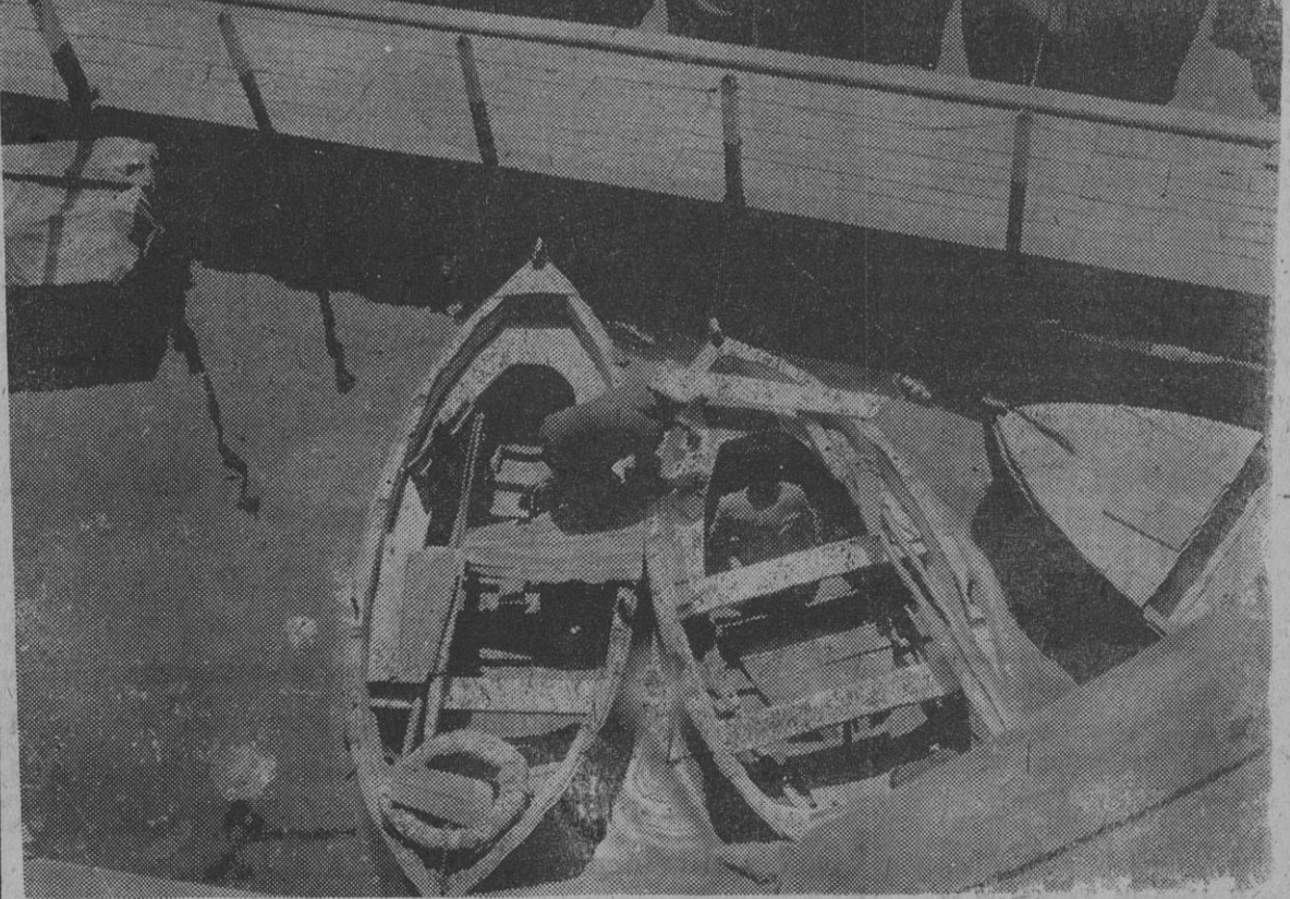
En pleno verano resulta muy agradable el dar un paseo por el puerto. Los barqueros que ven con la llegada del buen tiempo el principio de su época de trabajo se dedican ahora a arreglar los pequeños defectos...