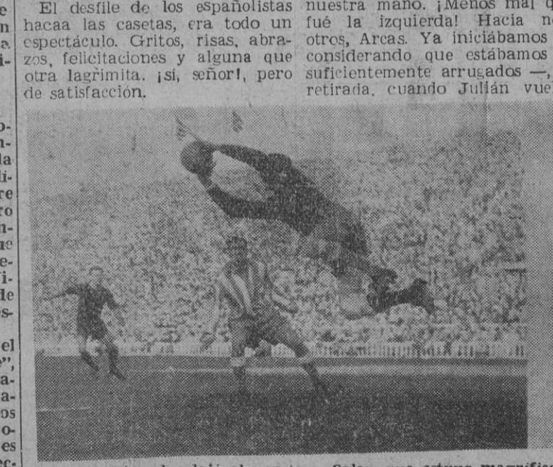
Vicente, lesionado, dejó el puesto a Soler, que estuvo magnifico y defendió su puerta a cal y canto de las arremetidas contrarias. Antes de su lesión, Vicente tuvo tiempo de hacer esta ágil intervención.