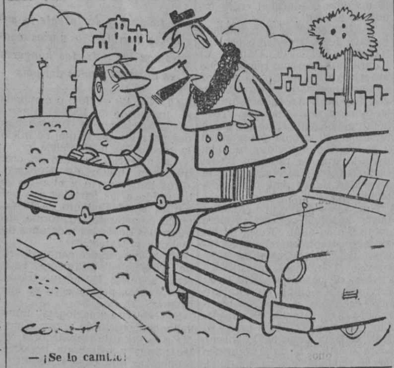
— ¡Se lo cambie!