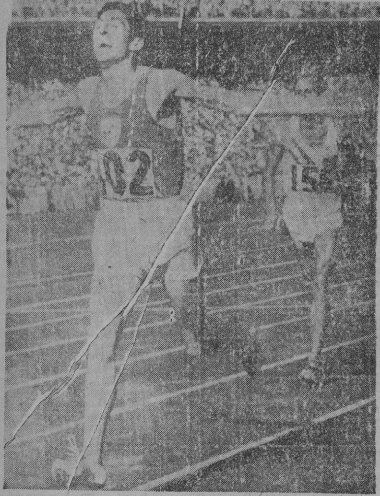
Ron Delaney, de Irlanda, ganó la carrera de los 1.500 metros. Su "maillot" verde surgió a 80 metros de la llegada, irresistible, para imponerse al gran favorito, John Landy, que se colocó en segundo lugar.

Cualquiera de los atletas de esta final olímpica, tiene —si sigue un tren rápido desde el principio— a su alcance el rebajar sensiblemente los 3 m. 40"6 que figuran hoy como record mundial.