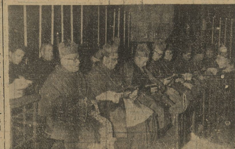
Presidencia de los prelatos que asistieron a la solemne misa celebrada en la iglesia de Santa María del Mar.

me siento feliz no sólo por ser su huésped, señor presidente, sino por encontrarme entre el amistoso y hospitalario pueblo norteamericano. Soy me ajena que mi visita será corta. Gracias, señor». — Efe.