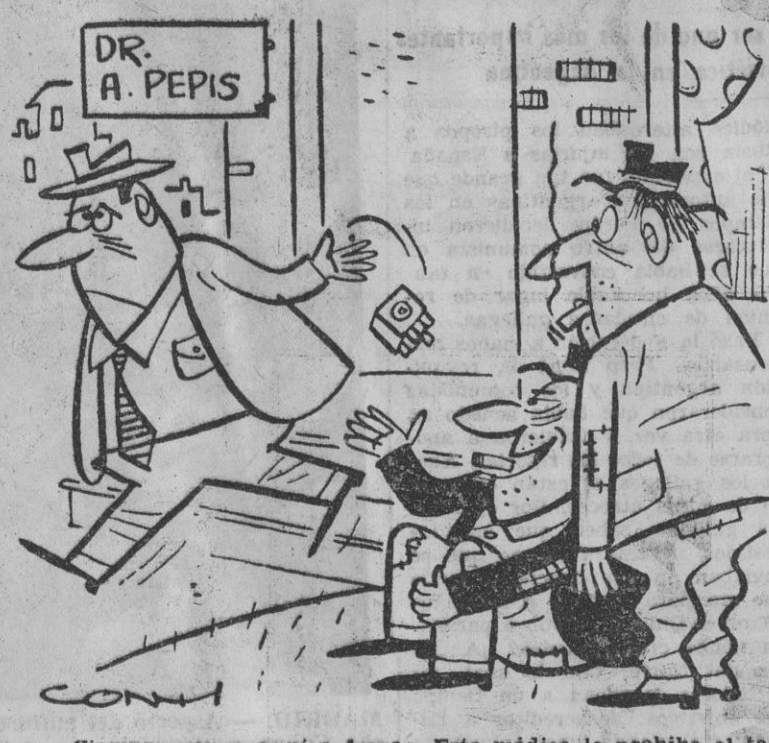
— Siempre vengo aquí a fumar. Este médico le prohíbe el tabaco a todos los pacientes que le visitan.