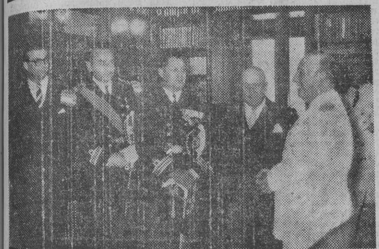
LA CORUÑA.—Un momento de la audiencia concedida por S. E. el Jefe del Estado a los marineros de la División naval colombiana llegada al puerto de El Ferrol del Caudillo.

Lo han remitido a un comité de técnicos para que lo redacten nuevamente de forma que pueda ser aceptado por las Naciones neutrales