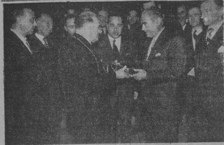
El alcalde de Luton, que acompaña a los jugadores del "Luton Town" en su viaje a Barcelona para jugar contra la selección catalana, entrega al alcalde accidental de Barcelona, señor Segón Gay, un obsequio en nombre de la ciudad inglesa por ellos representada, en la visita efectuada por los jugadores al Ayuntamiento.