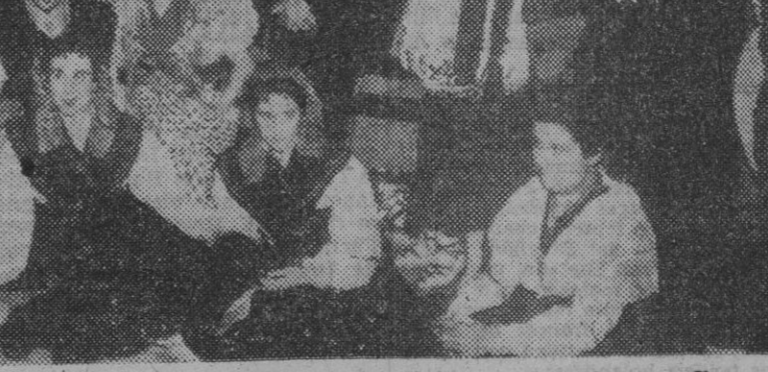
Un momento del homenaje ofrecido por el Casino español de La Habana a los "Coros y Danzas" de España, con asistencia del embajador español, señor Lojendio, y otras personalidades.

Mientras los Coros y Danzas siguen visitando sociedades, asilos, cufías, escuelas de La Habana, los grupos de Valladolid y Galicia asistieron a los programas de televisión de anoche, fueron muy aplaudidos por los demás asistentes. También continúan las representaciones en el Palacio de los Deportes, con gran éxito. — Efe.