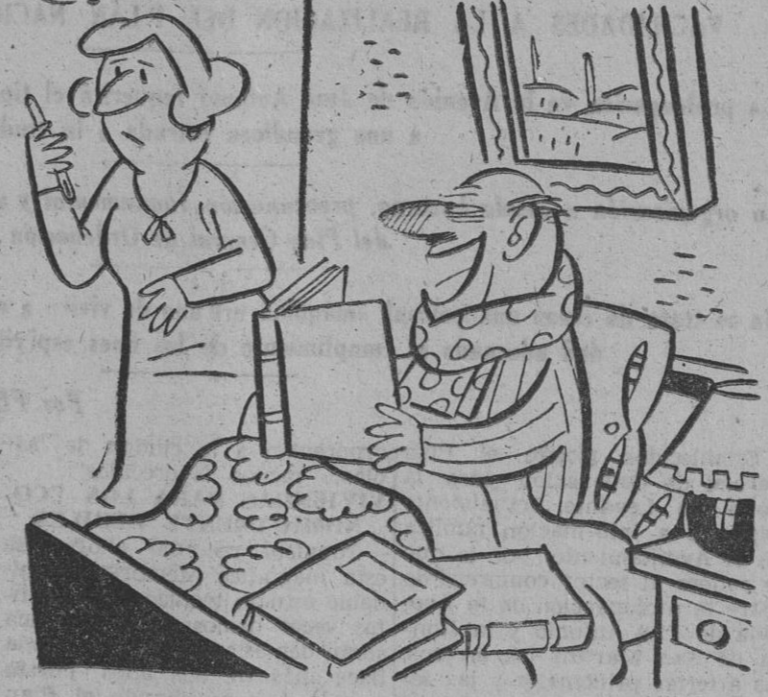
—¿Dices que tengo treinta y siete y medio? ¡Estupendo! Creí que este año me quedaba sin gripe.