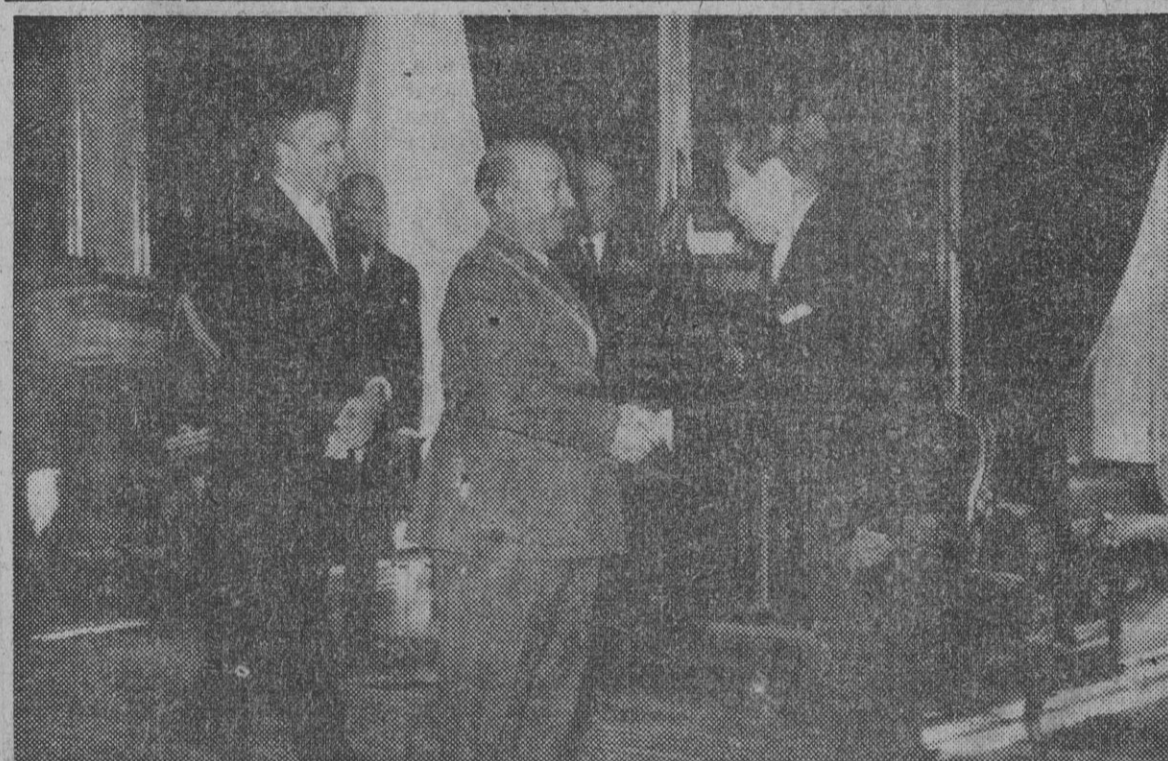
MADRID. — S. E. el Jefe del Estado durante el acto de la imposición del Collar de la Orden Nacional al Mérito del Ecuador por el embajador de dicho país en España, señor Alarcón Falconi, en presencia del ministro de Asuntos Exteriores, señor Marín Artajo.

El Collar de la Orden Ecuatoriana al Mérito, al Caudillo