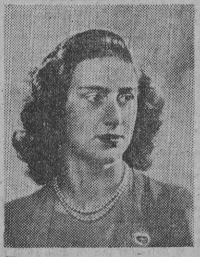
LONDRES, 25. — La princesa Margarita ha asistido a la representación de una revista musical de Broadway, con Lord Punket, que es su acompañante favorito desde que rompió con el coronel Townsend. Se trataba de una representación privada, con fines caritativos, de la obra «Plein and Fancy», que hoy se inaugura oficialmente. — Efe.

Este es su acompañante favorito desde que rompió con el coronel Townsend