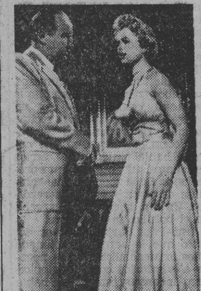
Broderick Crawford y Martha Hyer, en un interesante plano de la gran película "No hay crimen impune"...