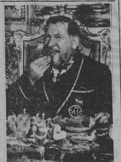
Gregory Ratoff, figura central de la extraordinaria película "Abdulla, el Grande"...