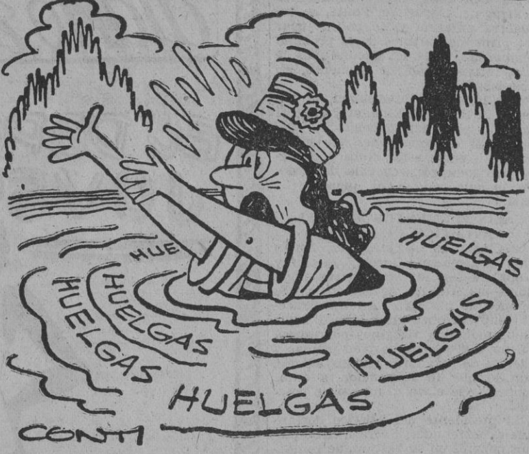
— ¿Dónde está el hombre que me ha de dar la mano?