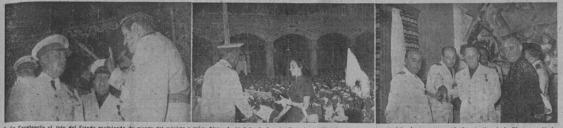
1. Su Excelencia el Jefe del Estado recibiendo de manos del ministro o señor Cirón, la Medalla de Oro del Trabajo. La foto muestra un momento del solemne acto. — 2. Con motivo de la Fiesta del 18 de Julio, S. E. el Jefe del Estado hizo entrega de los títulos de empresas y productores ejemplares. La foto muestra un momento del solemne acto en el palacio de El Pardo. — 3. El Caudillo, acompañado de ministros y autoridades, durante la inauguración de la residencia "José Antonio", de "Educación y Descanso", construida en el puerto de Navacerrada. — (Fotos Cifra)