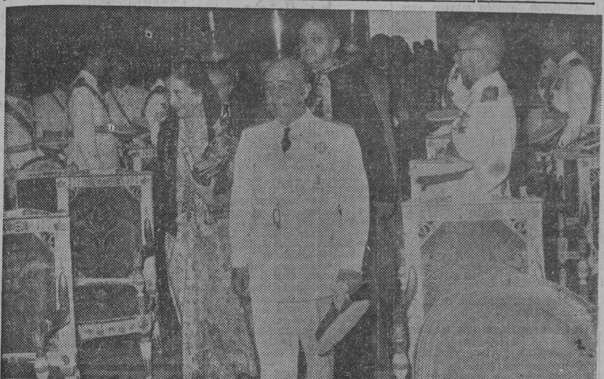
Su Excelencia el Jefe del Estado y su esposa se dirigen a la capilla del palacio de El Pardo para asistir a la ceremonia religiosa celebrada con motivo de la fiesta onomástica de la Excm. señora doña Carmen Polo de Franco.

Onomástica de la esposa de S. E. el Jefe del Estado