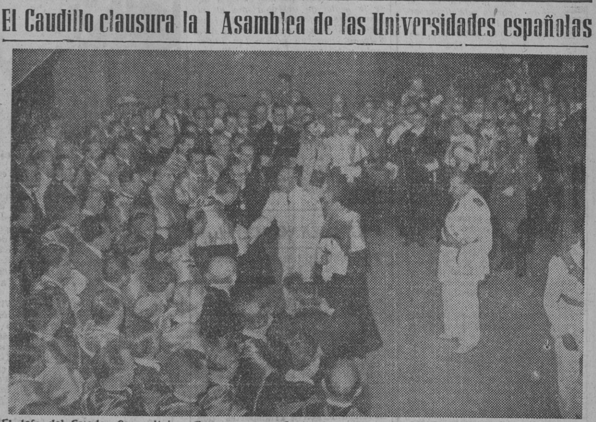
El Jefe del Estado, Generalísimo Franco, acompañado de varios ministros del Gobierno, presidió el acto de clausura de la I Asamblea de las Universidades españolas, que se ha celebrado en Madrid desde el 11 del mes actual. La foto nos muestra un momento de la llegada del Generalísimo.

SEUL, 17. — Las tropas aliadas han matado o herido a 21.000 comunistas en la semana que terminó en la medianoche del 14 de julio, según anuncia el VIII Ejército. Ha sido el mayor número de bajas causadas a los comunistas desde hace dos años, cuando se les causó 29.352 muertos en la semana que terminó el 19 de octubre de 1951. — Efe.