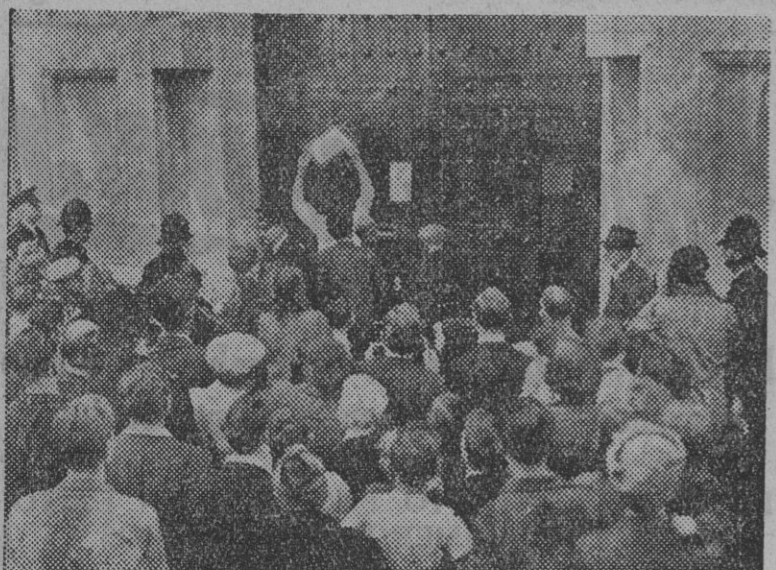
Un grupo de londinenses, entre los que figuran numerosos fotógrafos, se concentran en la puerta de la prisión de Penton Ville para leer el certificado oficial que acredita la ejecución del estrangulador John Reginald Christie, colocado momentos después de efectuarse la sentencia.