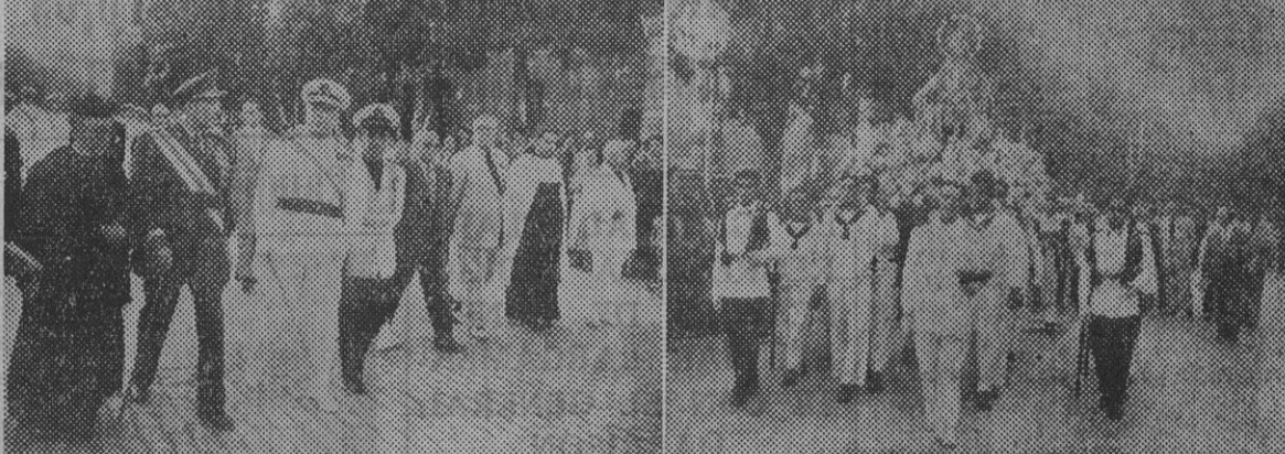
Presidencia oficial y un detalle de la procesión.