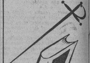
Solución al núm. 3.623 SI, ESTEBAN