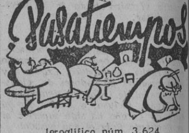
Jeroglífico núm. 3.624 ¿QUE BEBES?

PARIS, 17. — El ministro del Interior, Leon Martinand-Deplan, ha manifestado que la Policía hizo fuego «en legítima defensa» contra los manifestantes comunistas el día del aniversario de la toma de la Bastilla y en la que resultaron 7 muertos y 131 heridos. Al contestar a varias preguntas que le fueron formuladas en la Asamblea Nacional, manifestó que algunos policías hicieron fuego cuando «fueron amenazados con ser linchados». Ochenta y dos policías hubieron de ser curados y 20 tuvieron que ser hospitalizados, en los que se incluyen uno con la fractura del cráneo y otro que puede perder la vista. — Efe.