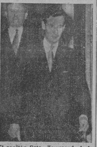
El capitán Peter Townsend, de la R. A. F., supuesto "novio secreto" de la princesa Margarita de Inglaterra, saliendo de la Embajada británica en Bruselas, en donde se le ha destinado en calidad de agregado militar.

El supuesto «novio secreto» de la princesa Margarita