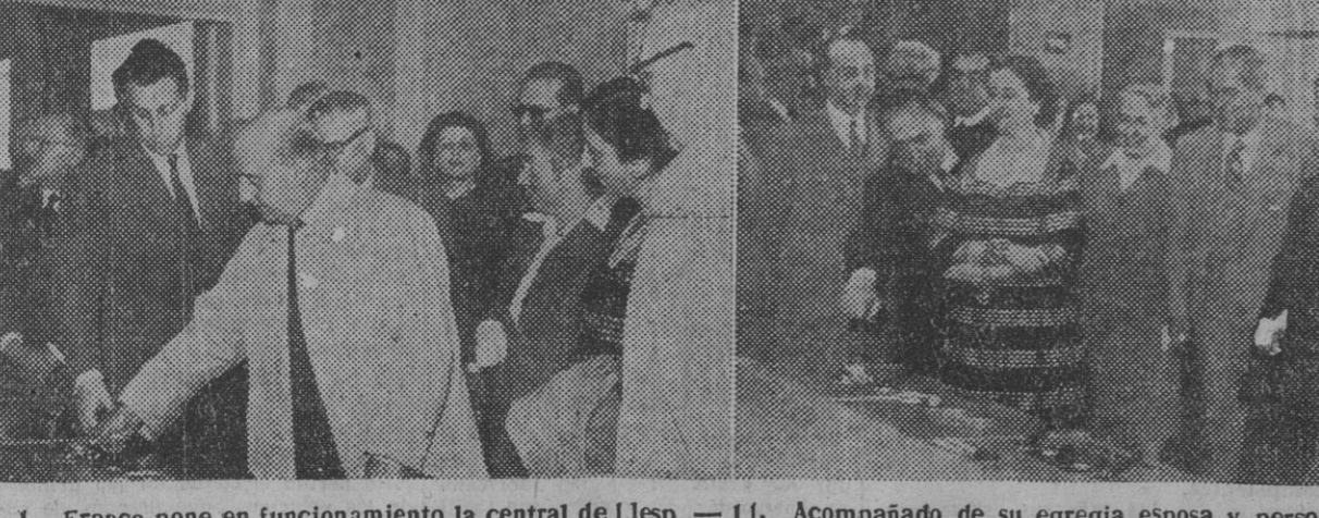
I. Franco pone en funcionamiento la central de Llesp. — II. Acompañado de su egregia esposa y personalidades de su séquito, el Caudillo asiste a la inauguración de la central de Villafer. — III. En la central de Bono. — IV. Vista general de las instalaciones hidroeléctricas de Senet, en cuyas fuentes de riqueza estuvo ayer S. E. el jefe del Estado.

El salto de Escales inaugurado ayer por S. E. el jefe del Estado, tiene una presa de 116 metros de altura y es una de las más notables de Europa. Cierra el gran embalse, cuya cola empieza en Pont de Suert y tiene una longitud de 12 kilómetros, y la capacidad del embalse de 145 millones de metros cúbicos. La central, totalmente subterránea, constará de tres grupos generadores, y tiene una potencia en turbina de 50.400 caballos de vapor, con una producción anual de 131.511 kilovatios hora. La central está totalmente terminada y situada a una profundidad de 300 metros bajo una enorme montaña, para