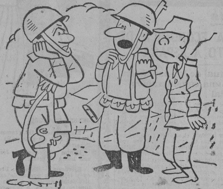
— He detenido a este individuo en la carretera y no sé si es nortecoreano, surcoreano, comunista, anticomunista, soldado prisionero fugado o espía. Lo peor es que él tampoco lo sabe.