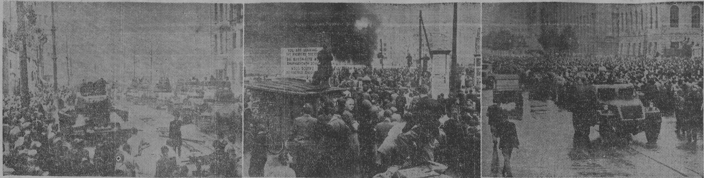
Según las noticias que facilitan las agencias informativas, las manifestaciones anticomunistas y las huelgas se extienden por toda la zona soviética de Alemania. Las autoridades rusas han decretado el estado de sitio en varias ciudades, simultáneamente con el despliegue de una División acorazada con 270 carros de combate, artillería motorizada, y otros elementos. En la primera fotografía podemos ver un escuadrón de tanques rusos "T-34", estacionados frente a los edificios gubernamentales de Berlín, rodeados por la población, que se mantiene a la expectativa. — II. Más allá de un letrero que avisa el límite del sector americano, los manifestantes obreros queman, en plena zona soviética, montañas de propaganda roja, arrancada previamente de los centros comunistas del Berlín oriental. III. Tropas motorizadas rusas en pie de guerra recorren la Unter Den Linden, en el Berlín oriental, frente al edificio de la Universidad, donde se había concentrado un apretado grupo de obreros para expresar sus protestas contra los soviets. — (Fotos Associated Press)