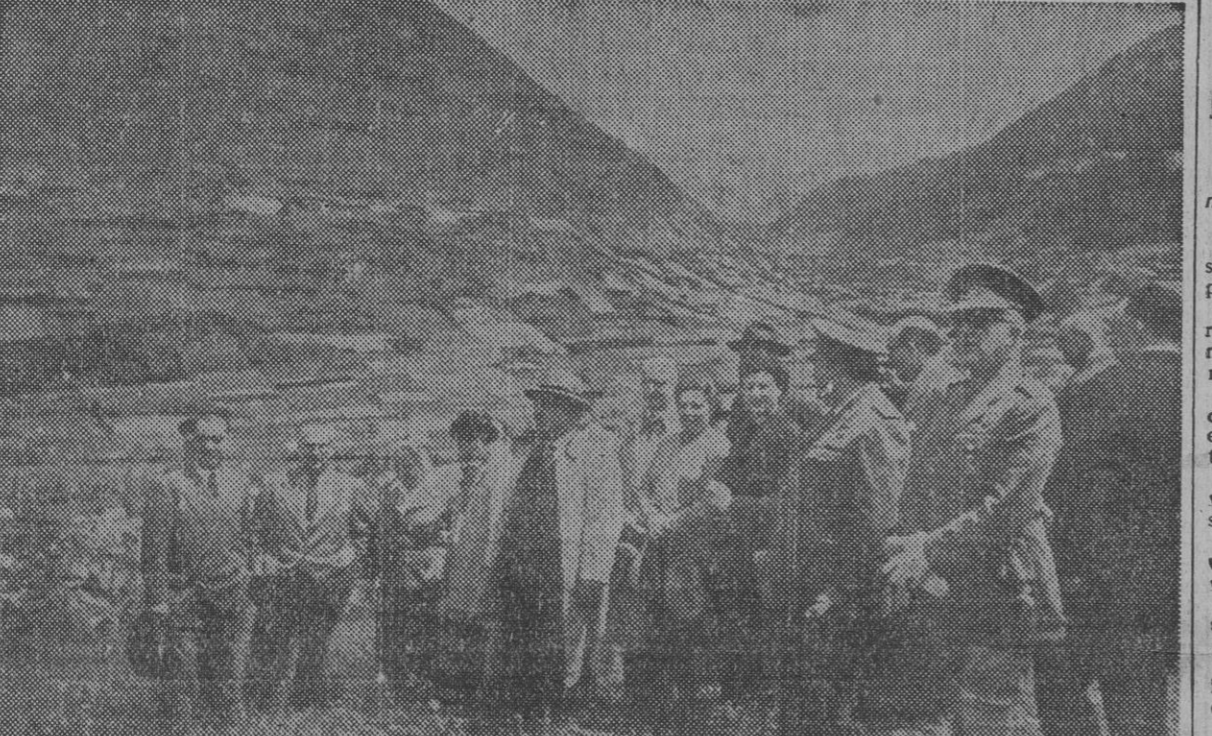
S. E. el jefe del Estado, Generalísimo Franco, acompañado de su esposa y personalidades que forman el séquito del Caudillo, durante la visita efectuada ayer al túnel de Viella. La foto ha sido tomada a la salida del túnel.

DEMARCACION DE ESCALES (Huesca), 19. — A las seis y media de la tarde de ayer S. E. el jefe del Estado llegó a esta zona para visitar las obras del salto y presa de Escales, en la zona media del río Noguera-Ribagorzana. El lugar es impre-