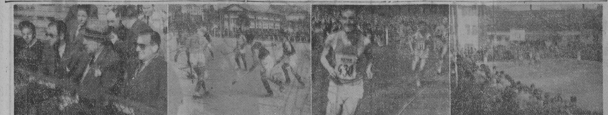
I. El gobernador civil, señor Acedo Colunga, preside, en Montjuich, una fase de los Juegos Universitarios. — II. Zaragoza impuso su superioridad a Murcia en el encuentro de hockey sobre tierra. — III. Un momento de la prueba de 1.500 metros lisos, que ganó el barcelonés Albers. — IV. Por un solo punto, y en dramático choque, Barcelona ganó a Santiago en baloncesto. — (Fotos Pérez de Rozas)