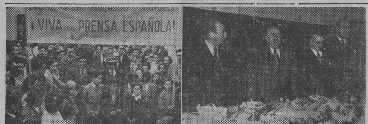
Con motivo de la inauguración de curso en la Escuela Oficial de Periodismo en nuestra ciudad, el director general de Prensa, don Juan Aparicio, presidió una excursión que los profesores de la Escuela y alumnos admitidos en este primer curso efectúan ayer a San Hilario Sacalm y Girona. La información gráfica recoge una nota de la cariñosa acogida dispensada a los excursionistas en San Hilario y un momento del discurso pronunciado por el director general de Prensa en la merienda-cena ofrecida por el gobernador civil de Girona a unos trescientos directores, profesores y alumnos.