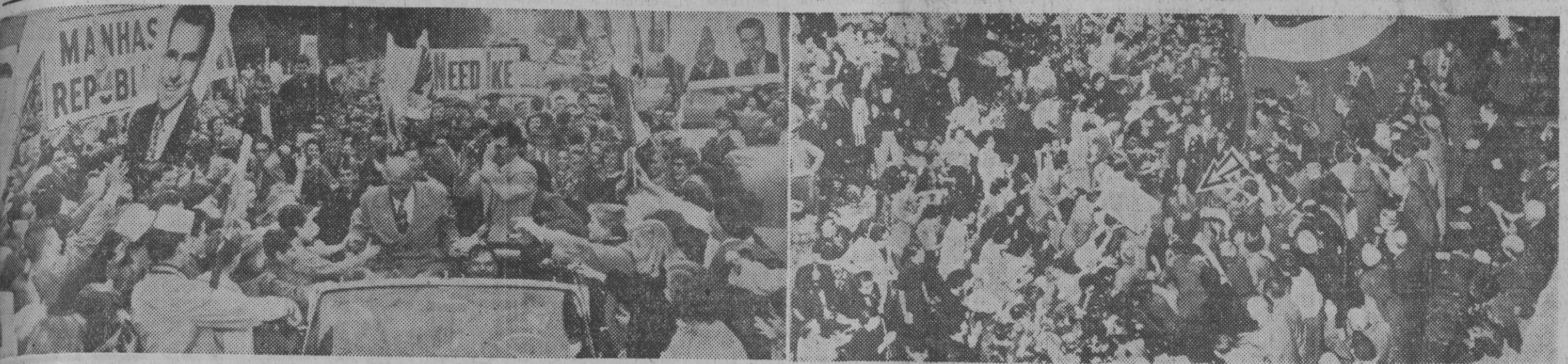
En la fotografía de la derecha, vemos al general Eisenhower, candidato republicano a la Presidencia de los EE. UU. visitando los suburbios de Nueva York. Pasa su coche por Manhasset, Long Island, y la multitud de sus partidarios le aclama tanto como la de demócratas reunida en el Madison Square-Garden lo hace a su candidato Adlai Stevenson —derecha, señalado con una flecha— cuando, el mismo día y a la misma hora, se presentó en dicho lugar para dirigir la palabra a unas 20.000 personas.