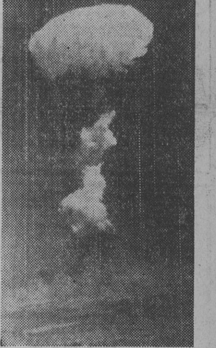
Fotografía televisada correspondiente a la explosión atómica realizada por el Gobierno norteamericano en Nevada. La foto fue tomada desde una distancia de 40 millas, en la cumbre del monte Charleston.

Pánico atómico Varios sabios trataron de calmar la curiosidad del mundo haciendo declaraciones sobre la nueva fuente de energía. La mayoría de los físicos pretendieron transmitir al Mundo la confianza, el optimismo y el entusiasmo que a ellos les embargaba. Federico Joliot, el marido de Irene Curie, manifestó que personalmente estaba convencido de que a despecho de los sentimientos provocados por la aplicación para fines destructivos de la energía atómica, ésta prestaría a los hombres, en la paz, servicios inestimables. Por su parte, Louis de Broglie, dijo: "Hay en ello un progreso decisivo del que podrá la ciencia extraer inmensos beneficios para fines pacíficos." "Se ha podido decir