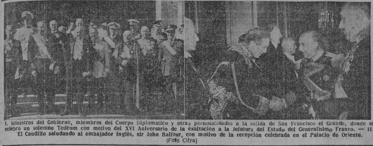
1. Ministros del Gobierno, miembros del Cuerpo Diplomático y otras personalidades a la salida de San Francisco el Grande, donde se celebró un solemne Teódeum con motivo del XVI Aniversario de la Jefatura del Estado del Generalísimo Franco. — 11. El Caudillo saludando al embajador inglés, sir John Balfour, con motivo de la recepción celebrada en el Palacio de Oriente.