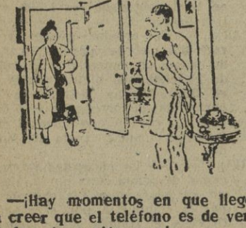
—Hay momentos en que llego a creer que el teléfono es de verdadera invención rusa!