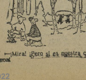
—Mira! ¡Pero si es nuestra casa!