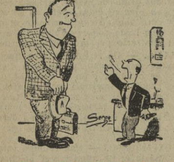
—Salga! ¡Salga usted o le abofeteo... o llamo al timbre para que le acompañen!