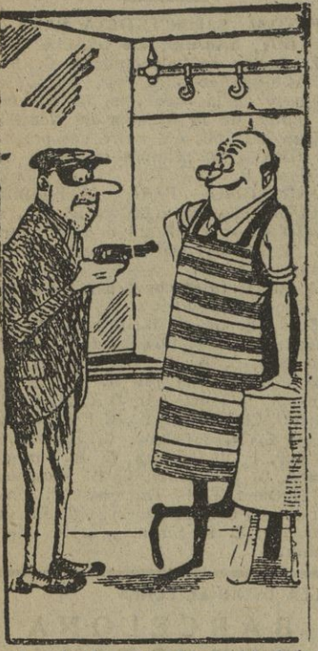
—Lo siento, pero llega usted demasiado tarde. La carne está ya en el frigorífico y la caja cerrada.