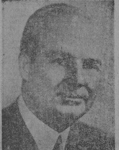
Vemos en la foto presente al director de la Cities Service Company, gran entidad petrolera americana, a su llegada al aeropuerto de Teherán después de la invitación que le fue hecha por el jefe del Gobierno de este país, doctor Mussadeq.

En octubre será retirada de la Argentina la Misión militar norteamericana