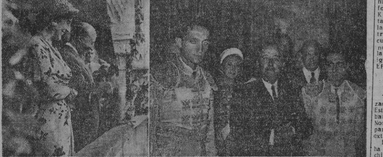
1. Su Excelencia el Jefe del Estado y su distinguida esposa, son aclamados por el público al hacer acto de presencia en la Plaza de Toros de San Sebastián, donde asistieron a la corrida del pasado viernes. — II. Los diestros Aparicio, "Liri" y "Jumillan" (este último no aparece en la foto), con el Generalísimo durante un breve descanso de la lidia.

COMUNIS. TENTIAL A TAL don unistas advertido que "este n la zona "tschland", a, ataca is de Ber- a la frase a una isla el mar", provoca- anticomun- comunistas Efe. POR LA UNKERS" da la san- posesión de a Infante- ricana ha Efeos asal- INGLATERRA a de cin- lían en los distrito de las inunda- el río Bray la se han por las in- lundando gran- itura y la te. — Efe. ros 3,341 TENIASI 3,340 NADA 3,441 estancia muy española. 3, antología per- En el tér- una letra. Obediencia. 7, una de las tienen los mero - Villa videña - Lo tenas oscil- 3,440 2, lba 4, Amar- to - Cld. 7, 9, Bata 3, 3, 34 4, Ex 5, Rica - Al- bas. me, ombre, 93