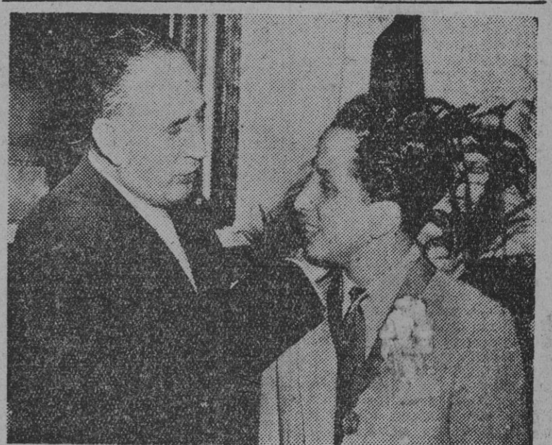
El alcalde de Nueva York, Vincent Impellitteri, impone al rey Feisal II, del Irak, la Medalla de Honor de la Ciudad, durante su visita al Ayuntamiento.