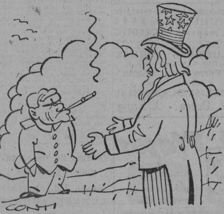
—¿Dioscientos treinta millones! ¿Eso es para una ayuda o que me vende toda Yugoslavia?