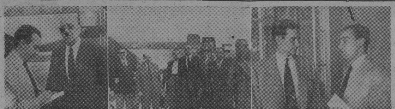
Presidida por el delegado nacional de Deportes, laureado teniente general Moscardó, pasó esta mañana, por el aeropuerto del Prat, camino de Helsinki la Delegación oficial española que concurrirá a los Juegos Olímpicos. En nuestras fotografías puede verse a don José Moscardó hablando con nuestro redactor, al grupo de expedicionarios, y a don Juan Antonio Samaranch, vicepresidente de la Federación Internacional de Hockey, que concurrirá asimismo al magnó certamen deportivo.