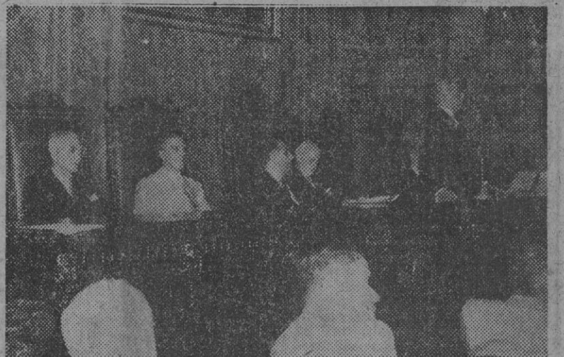
Presidencia de la solemne inauguración del IV Congreso Internacional de Abogados, cuyo acto tuvo efecto ayer, en el salón de actos del Colegio de Abogados de Madrid. En la foto figuran los ministros de Justicia y de Hacienda, el de Justicia de Filipinas y otras altas personalidades nacionales y extranjeras.

Inauguración del IV Congreso Internacional de Abogados