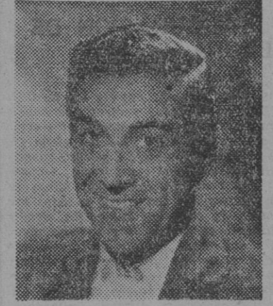
Luis Mariano, brillante protagonista de la película musical "Cita en Granada", que próximamente será estrenada en Barcelona