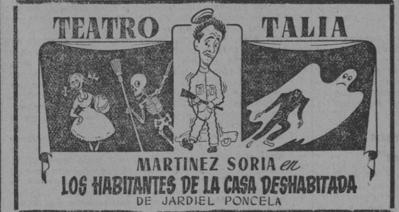
MARTINEZ SORIA en LOS HABITANTES DE LA CASA DESHABITADA DE JARDIEL PONCELA