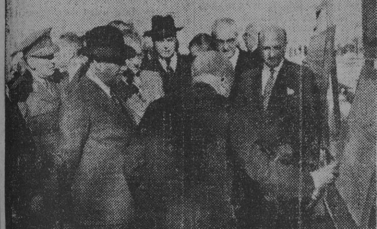
S. E. el Jefe del Estado, acompañado de los ministros del Ejército, Gobernación y de Industria y otras personalidades, durante la visita de ayer tarde, a la Zona Franca del Puerto, donde se están llevando a cabo los trabajos para la instalación de una fábrica de automóviles de turismo.

Su Excelencia el Jefe del Estado visitó ayer tarde los trabajos que se realizan para la erección de la gran fábrica de automóviles de turismo S. E. A. T., en el recinto de la Zona Franca.