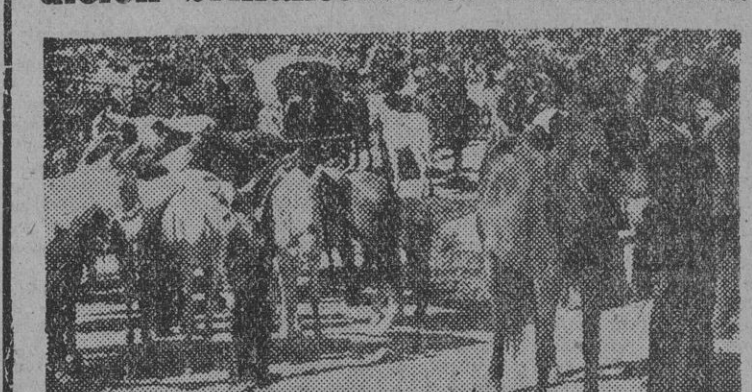
Vich celebra este año con extraordinaria amplitud su tradicional «Mercat del Ram», en un nobilísimo esfuerzo colectivo para recuperar la brillantez de este secular certamen.