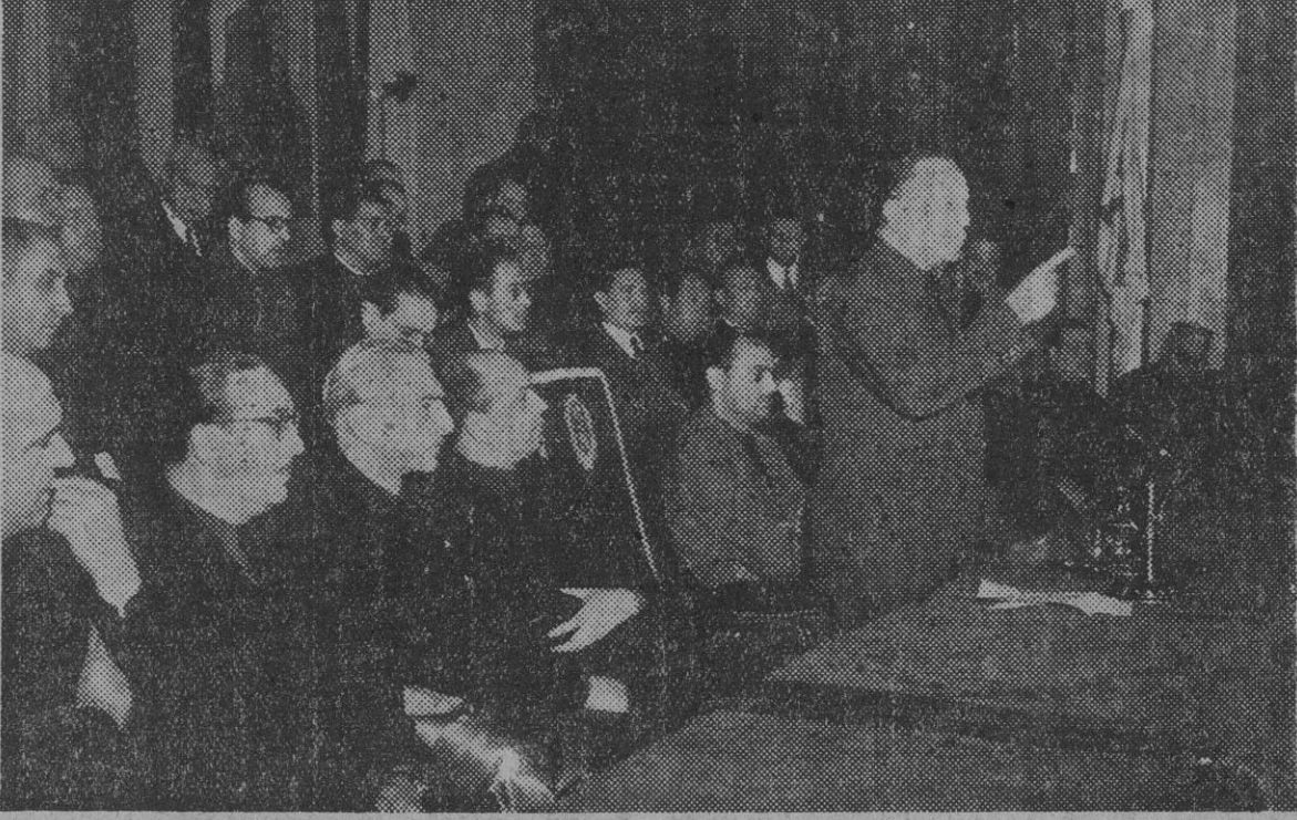
El ministro secretario general del Movimiento, el marqués Raimundo Fernández Cuesta, durante el importante discurso que pronunció, ayer, en el Monumental Cinema, de Madrid, durante el acto de la proclamación de candidatos sindicales a procuradores en Cortes.