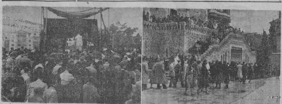
Como en años anteriores, esta mañana se ha celebrado una solemne misa en el templo de San José de la Montaña. Nuestro redactor gráfico, Pérez de Rozas, ha captado estas dos instantáneas que dan muestra del gran número de fieles que acudieron al pladoso acto.