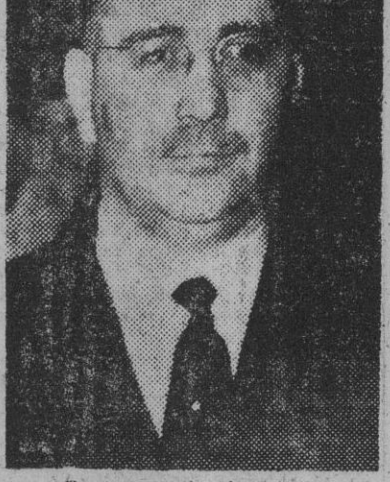
Doctor Paolo da Cunha

Los fotógrafos nos cercan buscando el mejor ángulo para la fotografía. Luego es preciso continuar parado unos instantes mientras el ministro de Asuntos Exteriores lusitano saluda a Acheson y Eden, que des-cuento al porvenir, ciñendonos a este tema de España y Portugal en la N. A. T. O. y a la política mundial. — Si, creo en el futuro. El embajador Mac Veagh, que fué en Portugal un gran, un admirable embajador, sabrá conducir con su pulso certero las negociaciones así que fije su residencia en Madrid. Y creo que será de una manera muy útil para la causa común. Es decir, para España, Portugal y los Estados Unidos. — Una última pregunta, señor ministro, ya que tanto estoy abusando de su paciencia y de su lusitana cortesía: ¿Podría escribir unas palabras expresamente para "Arriba", de Madrid y la Prensa del Movimiento? — Y entonces el ministro de Negocios Extranjero, portugués, señor Paulo Cunha, sin duda, el ministro de la N. A. T. O. de más rango y proceridad, escribió en lengua lusitana y sobre mi misero y sencillo block de periodista pobre, estas palabras con que cerró la entrevista sobre el tema que apasiona la Conferencia de Lisboa: "Saludo al "Arriba", ese periódico español tan querido en Portugal. Con las mejores "saudades" de Paulo Cunha."