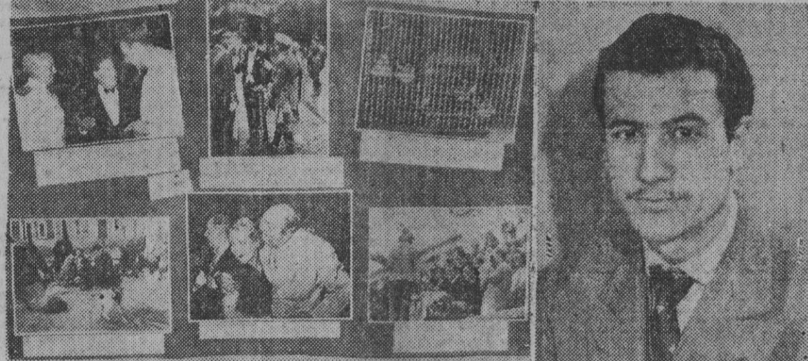
1. Reportaje titulado "Objetivo indiscreto", presentado en dicha Exposición por el fotógrafo de la Agencia Cifra, don Jaime Pato, que ha obtenido el primer premio. — 2. Una fotografía del señor Pato.