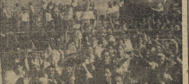
Manifestación de antibrutalismo en El Cairo al conocerse la proposición de romper el tratado angloegipcio que ha presentado el Gobierno. Aquí se ve a los manifestantes que gritaban abajo Inglaterra.

LONDRES, 13. — El secretario del Foreign Office, Herbert Morrison, ha advertido a Egipto, que Gran Bretaña contestará a la fuerza con la fuerza si Egipto intenta arrojar a las tropas británicas de sus bases en la zona del Canal de Suez. — Efe.