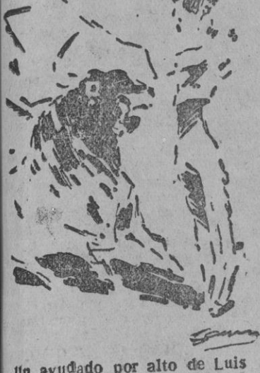
Un ayudado por alto de Luis Miguel «Dominguín»