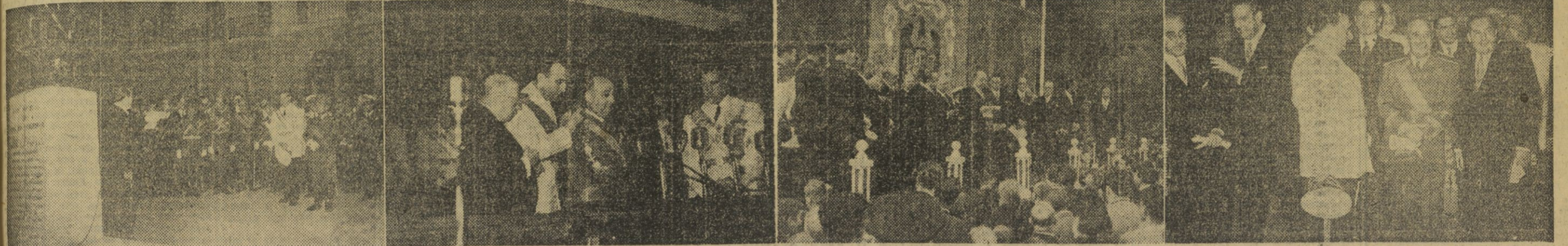
El Caudillo inauguró el nuevo edificio del Instituto de Cultura Hispánica. — II. El ministro de Asuntos Exteriores del Perú, acompañado de ministros y otras personalidades, en el acto de inauguración del monumento a la Reina Católica, con motivo del Día de la Hispanidad, en la Ciudad Universitaria. — III. El embajador de los Estados Unidos, Mr. Stanton Griffiths, lee su discurso ante los miembros del Gobierno, ministro de Asuntos Exteriores del Perú, Cuerpo Diplomático y otras personalidades con motivo de dicha ofrenda a la Reina Isabel. — IV. S. E. el Jefe del Estado, acompañado de los miembros del Gobierno y otras personalidades, durante la inauguración de la I Bienal de Arte Hispanoamericano en el Palacio de Exposiciones del Retiro.