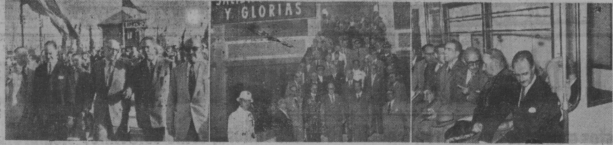
El alcalde de la ciudad, con otras autoridades, en el acto de inauguración del nuevo tramo Marina-Clot del Metro Transversal. Los asistieron al acto descendieron a los andenes para hacer el viaje inaugural, momento que ha sido recogido en la última fotografía de este reportaje.

Conforme anunciamos, tuvo efecto el solemne acto inaugural, precedido de la bendición por el señor obispo de la nueva sección Marina-Clot, del Ferrocarril Metropolitano Transversal, a continuación de cuya ceremonia se celebró, también, la bendición e inauguración del comienzo de las obras de prolongación de la línea Clot-Sagrera.