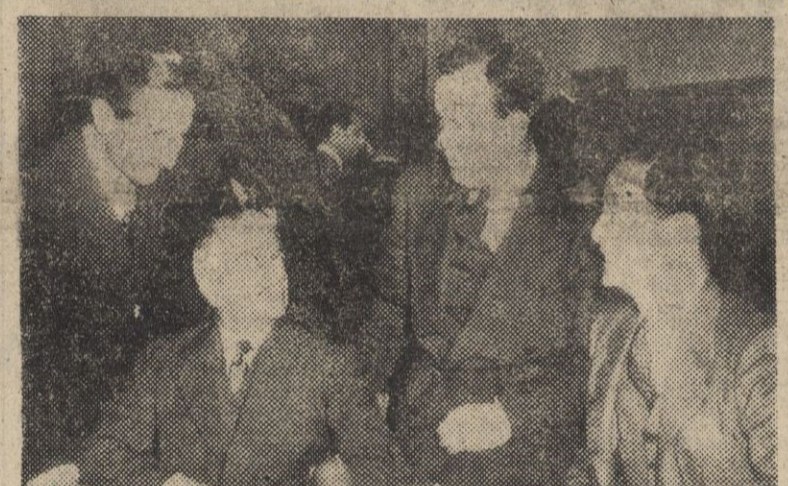
El Comité de los tres para la propuesta de «¡alto el fuego!» en Corea, conversan en Lake Success con el ministro de Asuntos Exteriores de Corea del Sur, Ben C. Limb (derecha), en un descanso de las reuniones celebradas.