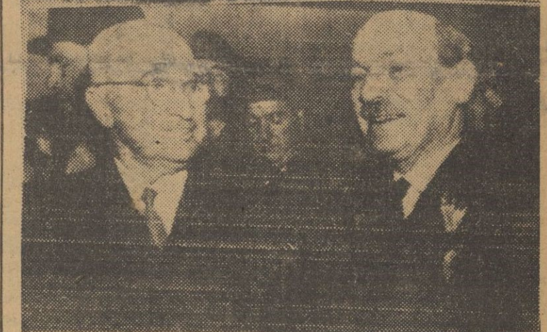
A su llegada a Washington, el "premier" inglés fué recibido en el aeropuerto por el presidente norteamericano, y, por primera vez, en estos días, aparecen juntos los dos hombres reunidos para tratar de evitar la tercera guerra mundial. Dicen que Attlee lleva "en el bolsillo" los puntos para convencer a Truman de que es más necesario ocuparse de Europa que de Asia.

El acuerdo de mantener firmemente el compromiso de luchar contra la