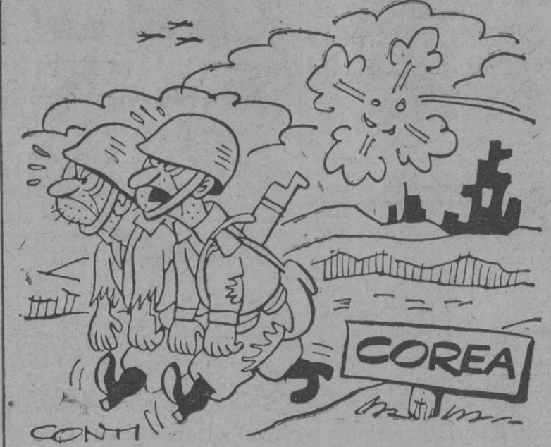
—¿Sabes a quien me gustaría encontrar ahora? ¡Al maldito que ideó ese paralelo 38!