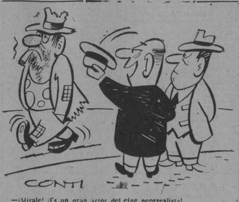
—¡Mirale! ¡Es un gran actor del cine neorrealista!