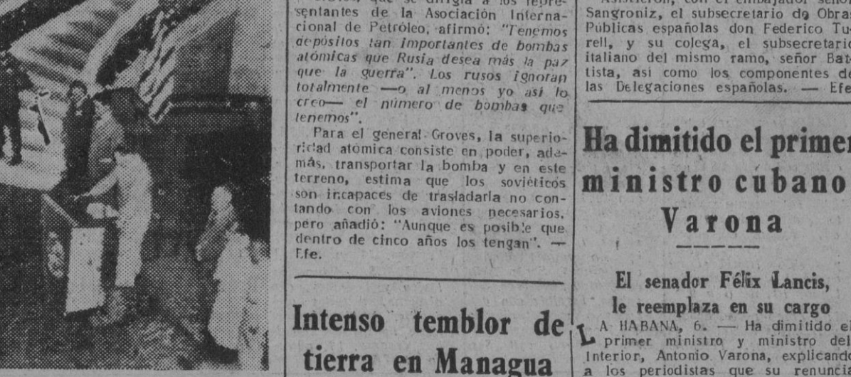
El general Mac Arthur el hombre que ha conducido a la victoria las fuerzas de la ONU en Corea, inicia una oración de acción de gracias al Señor, en el salón del Capitolio surcoreano, poco antes de hacer entrega oficial de los poderes civiles del territorio conquistado, al presidente Rhee.

Entrega de poderes al presidente de Corea