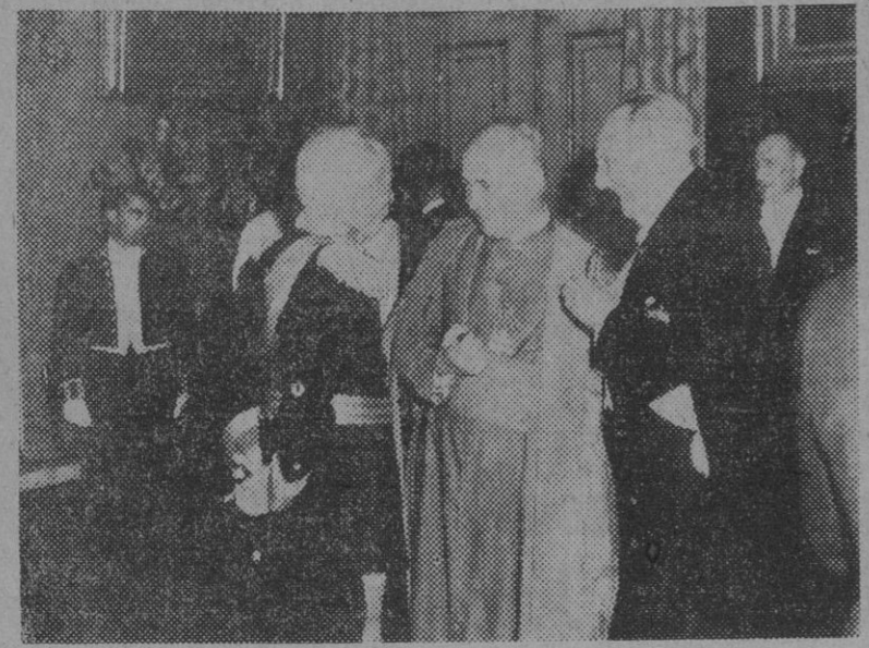
El presidente de Portugal, mariscal Carmona, con el cardenal legado, doctor Cerejeira, y el presidente de las Cortes Españolas, don Esteban Bilbao, en la recepción celebrada en el palacio de Belén, a la que asistieron, además, los ministros españoles de Gobernación y Justicia, que se encuentran en el país hermano con motivo de la peregrinación de las reliquias de San Juan de Dios.

Personalidades del Gobierno Español en Lisboa