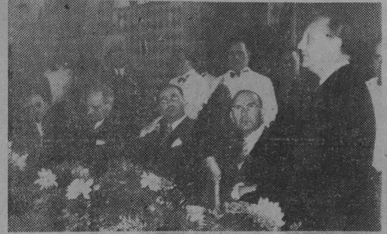
Don Raimundo Fernández Cuesta, ministro de Justicia, pronunciando su discurso durante el almuerzo de gala con que, junto con el ministro de la Gobernación y el presidente de las Cortes, fueron obsequiados en el palacio nacional de Cintra, por el ministro de Asuntos Exteriores de Portugal, doctor Paulo Cunha.