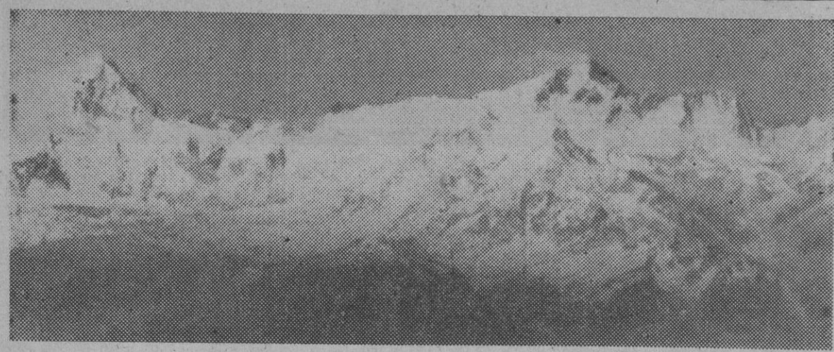
Vista panorámica de los montes Everest y del Makalu (izquierda), cuyos picos son los más altos de la cordillera del Himalaya. En la foto puede verse en la punta del Everest una estela luminosa producida por el polvo de nieve que levanta el soplo del monzón.