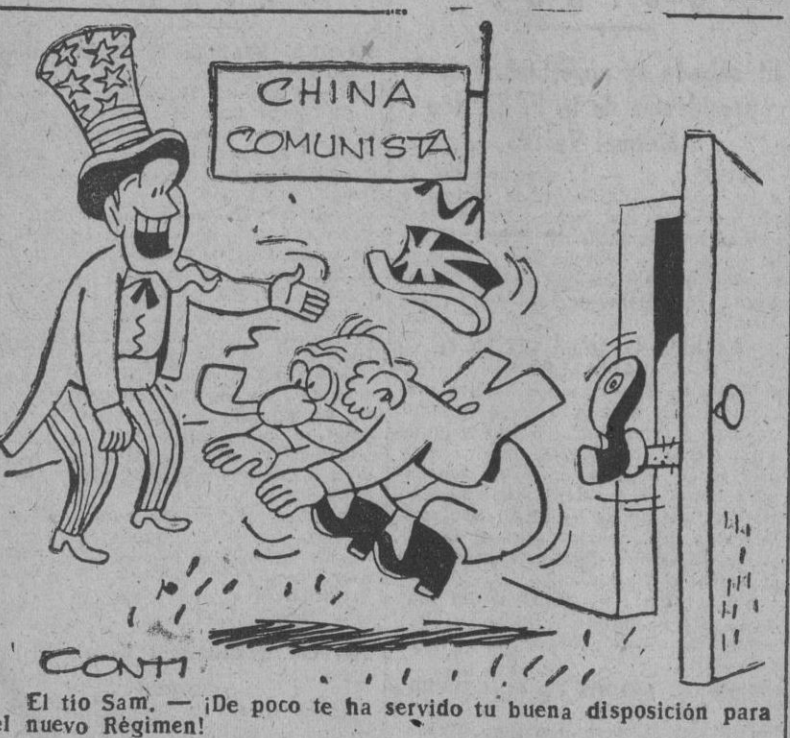
El tío Sam. — ¡De poco te ha servido tu buena disposición para el nuevo Régimen!