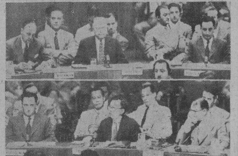
Dos momentos de la discusión sostenida en el Consejo de Seguridad acerca del problema de la isla de Formosa. Los rusos acusaron a Estados Unidos de haber cometido una agresión directa contra la isla. La acusación fué rechazada por mayoría de votos.