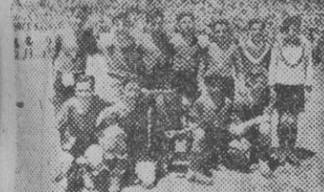
Y aquí están los peques del Colegio San Miguel. Estos dicen que el Comité seleccionará íntegro a su equipo. Decididamente estos muchachos son unos chicos modestos.

RUEGO A LOS DONANTES DE COPAS Y TROFEOS Rogamos a las entidades, clubs y particulares que nos han ofrecido copas y trofeos, nos los envíen a la mayor brevedad, al objeto de que figuren en la exposición que haremos y en la que constará el nombre del donante. Pueden enviarnos a Villarroel, 91. Redacción de LA PRENSA.