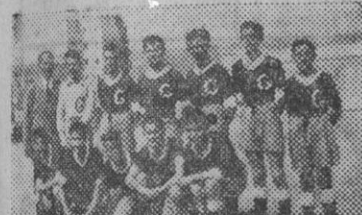
Aquí tienen ustedes a los fenómenos del Guinardó, que dicen que le pegan al balón como para cotizar sus fichas con traspaños sensacionales. Veremos a ver que dicen a esto sus contrarios del domingo