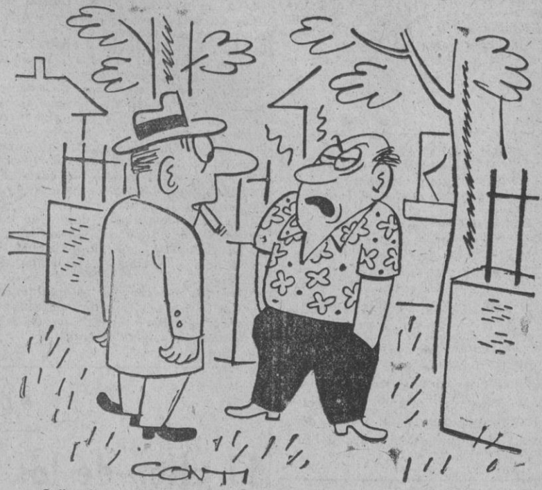
—¡Calla, hombre! ¡Desde que mi mujer vio los últimos modelos masculinos me tengo que poner sus blusas viejas!