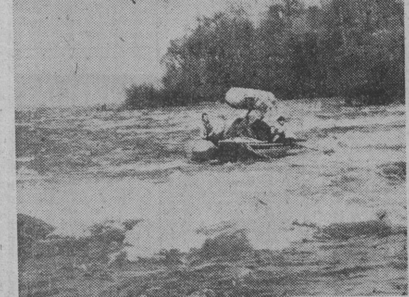
Difícil momento por el que atravesaron los dos pilotos de un autogiro que cayó al agua cuando trataban de salvar a una muchacha que había caído en el centro del Niágara. Afortunadamente, los tres pudieron ser salvados poco después.