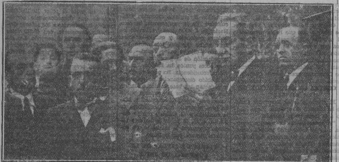
BILBAO.—Homenaje a la memoria de los patriotas muertos en la llamada rebelión de la sal. En el presente año, la ceremonia ha revestido particular solemnidad al adherirse a ella el Ayuntamiento de la Ilustre Villa. Momento en que el señor Alcalde le ha ofrecido

Analice en 50, 100 y 200 pesetas. Teléfono 1495