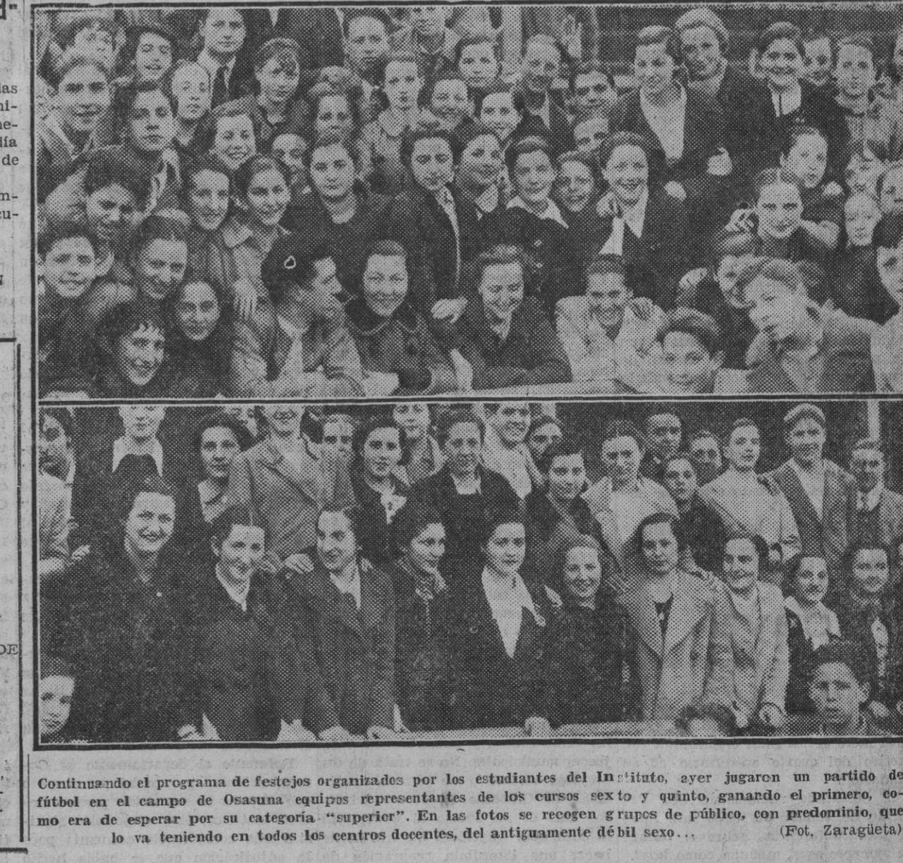
Continuando el programa de festejos organizados por los estudiantes del Instituto, ayer jugaron un partido de fútbol en el campo de Osasuna equipos representantes de los cursos sexto y quinto, ganando el primero, como era de esperar por su categoría "superior". En las fotos se recogen grupos de público, con predominio que lo va teniendo en todos los centros docentes, del antiguo régimen de sexo...

El señor Ramos, contestando a preguntas de los informadores, dijo que la reunión fue administrativa, no tratándose ningún tema político.