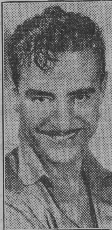
El famoso actor de cine John Gilbert, de tan grandes éxitos en la pantalla, entre los que destacan los alcanzados con "El gran desfile" y "El demonio y la carne", que acaba de fallecer a los treinta y nueve años de edad a consecuencia de un ataque cardíaco.

La hora del comienzo es a las siete de la tarde y fundamentalmente se confía en que la animación sobrepasará a la de días anteriores.