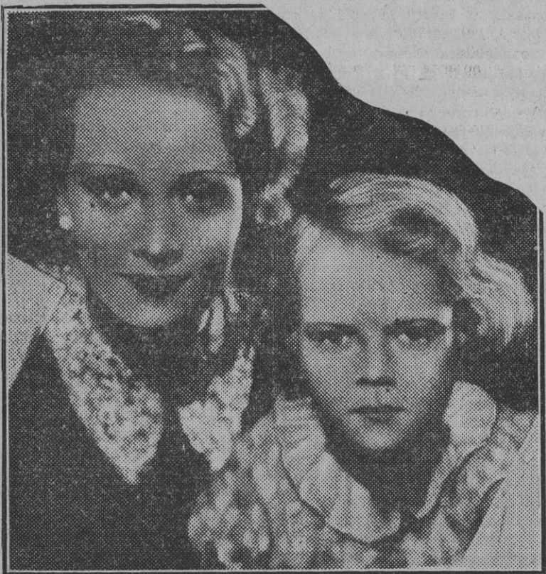
Marlene Dietrich y su hija, que abandonan definitivamente Hollywood para escapar de las amenazas constantes de los secuestradores