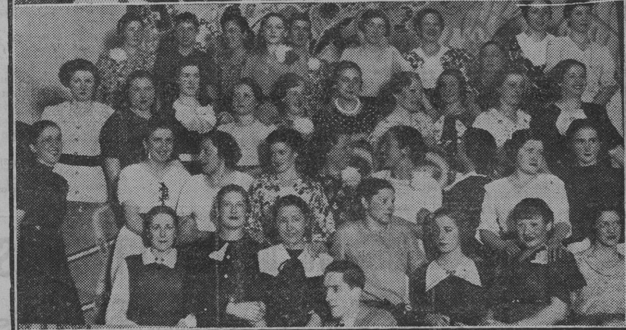
LA FIESTA DE LAS MODISTAS.—Después de la misa una vuelta por los sitios céntricos. Por la tarde, a merendar en Niza, o bailar en Olimpia.