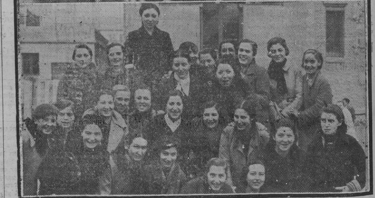
EL DIA DE SANTA CECILIA.—Grupos de lindas muchachas que ayer holgaron por la fiesta de su Santa Patrona y hoy volverán con igual alegría al trabajo, en el que todas querrán hallar la senda de la "alta costura" y la mayoría se verán encantadas con un galán simpático y apuesto.