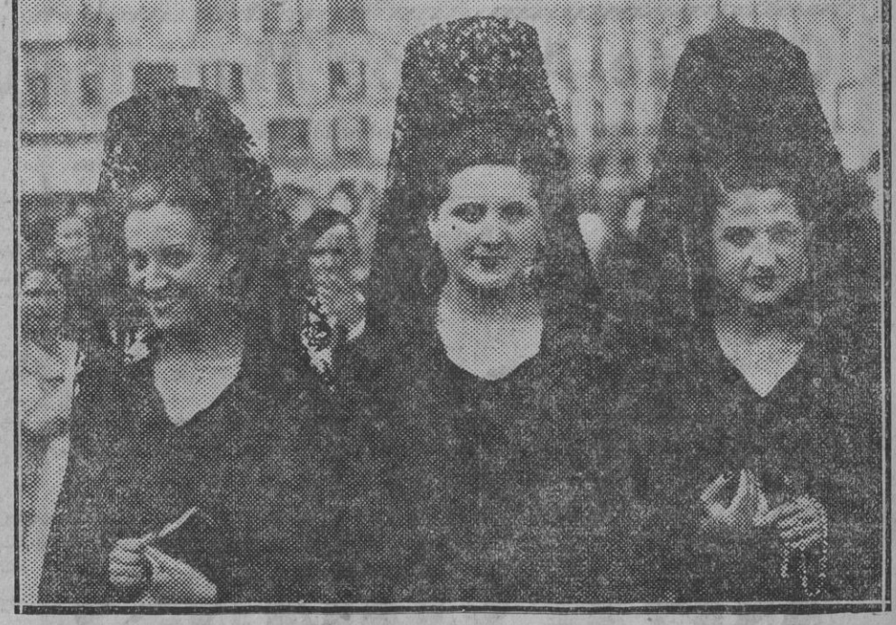
Otro grupo de bellas señoritas que tocadas con la graciosa mantilla visitaron devotamente a Jesús en los "Monumentos".

Hay a las ocho en punto de la noche, ensayo de conjunto. Se recomienda la puntual asistencia.