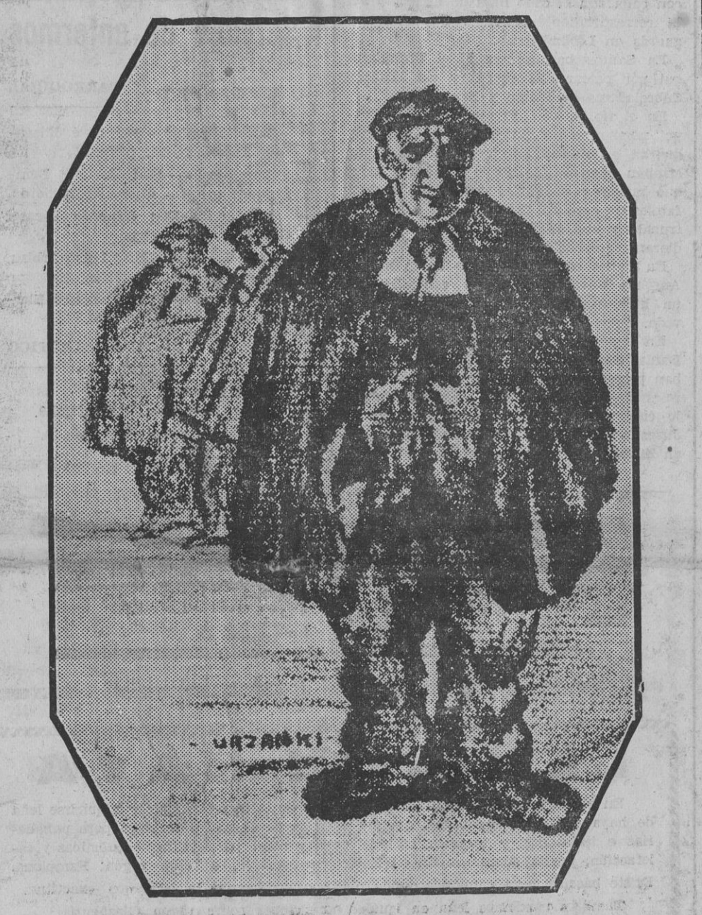
El "apostel". Este es uno de los personajes del Jueves Santo. El pobre anciano se ve ese día cuidado, atendido, y aun agasajado. Nada menos que el señor Obispo se arrodilla a sus pies para lavarlos. Mientras discurre por las calles un poco asombrado, lo ha captado el fácil y certero lápiz de Urzainki