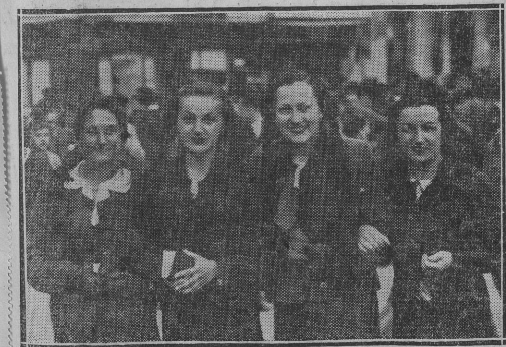
He aquí un grupo de encantadoras y devotas señoritas que el Jueves Santo recorrieron los templos en piadosa peregrinación.