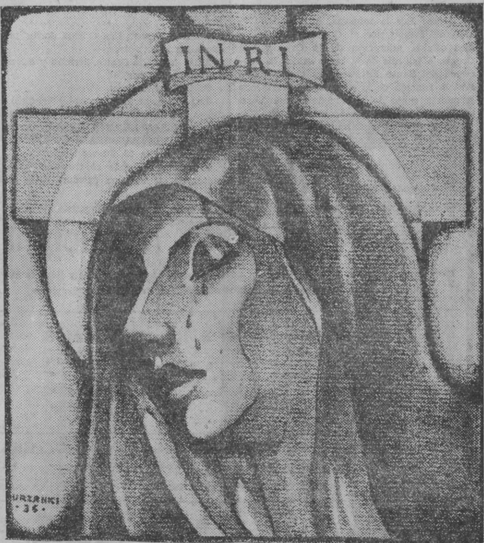
MATER DOLOROSA (Delicada y bella evocación del rotabte dibujante Urzanki)