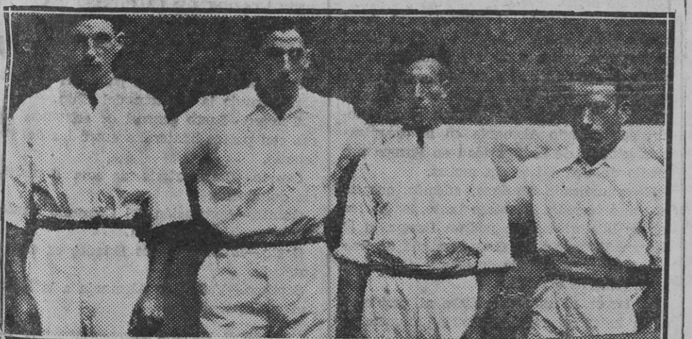
Los pelotaris "amaters" Arin (hermanos) de Betsu, y Egnans y Zabala de Monreal. Ganaron los últimos después de una bonita e interesante lucha

trado y difícilmente podrá hallarse como lo atestiguan, lo absurdo de los resultados que a través de la fase final de la segunda división van sucediéndose.