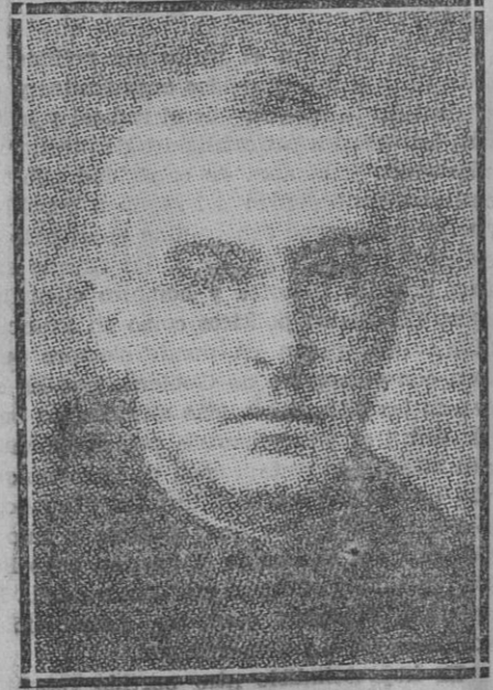
El gran católico inglés Bourne, Primado de Inglaterra, y Cardenal de la Santa Iglesia Romana.

Según se dice, se está librando una gran batalla a cinco kilómetros de Caranday, posición que los paraguayos tratan de tomar.