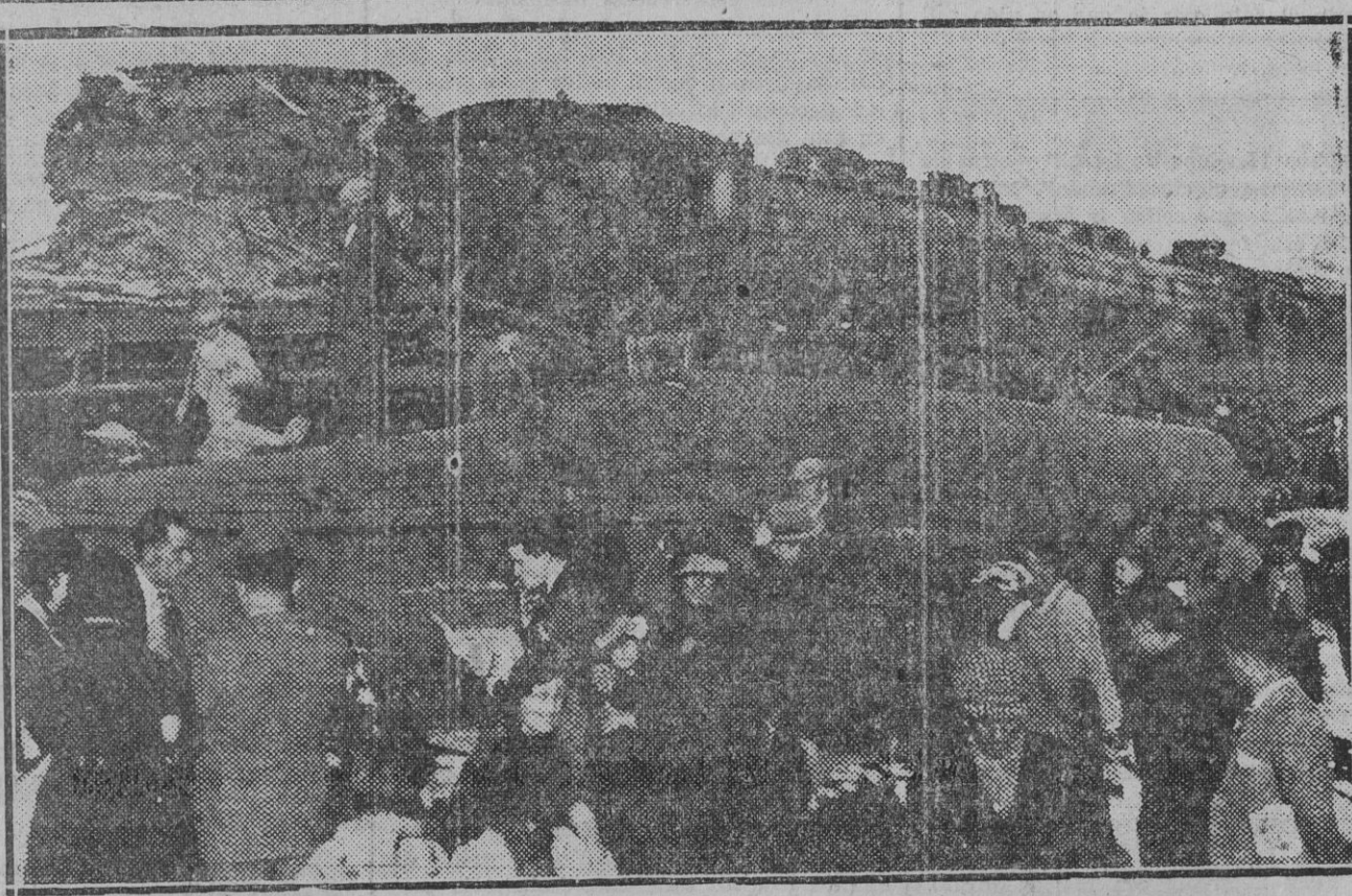
El choque de trenes en Villanueva de la Reina. Estado en que quedaron las máquinas