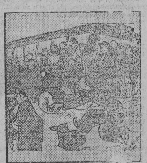
--No corra usted así, hombre. Ya cogerá usted el autobús próximo. --Es que soy el conductor de eso que se va. ("420", Florencia)