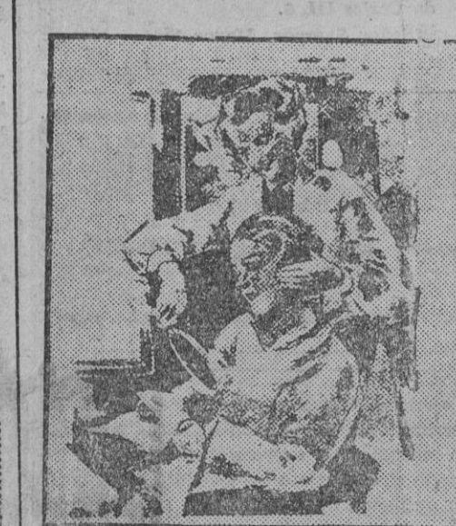
--Tiene usted el pelo más hermoso del mundo. --¿Lo cree usted así verdaderamente? --Señora: ninguna cliente pone eso en duda cuando se lo digo. ("Fleegende Blatter", Munich)