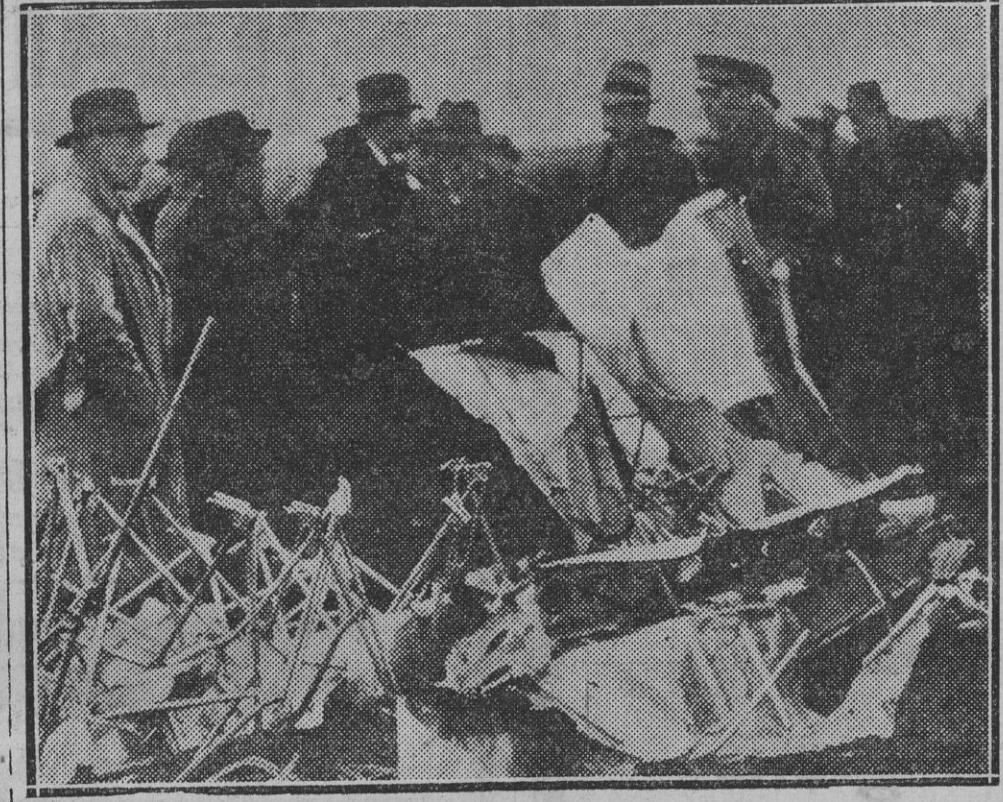
Resiste el avión "Emerante". El Ministro de Aviación Mr. Pierre Cot, que acudió desde el primer momento al lugar de la catástrofe, con otras personalidades

Se han desarrollado con tal motivo escenas de entusiasmo en las calles.