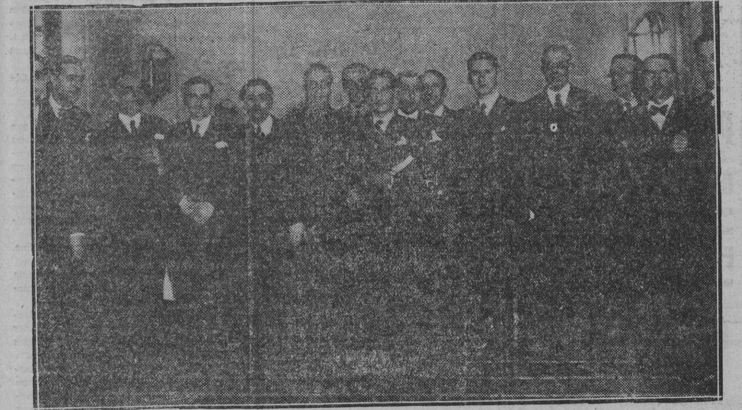
Los Diputados que forman la minoría nacionalista vasca, durante la visita que han hecho al periódico "Ahora"