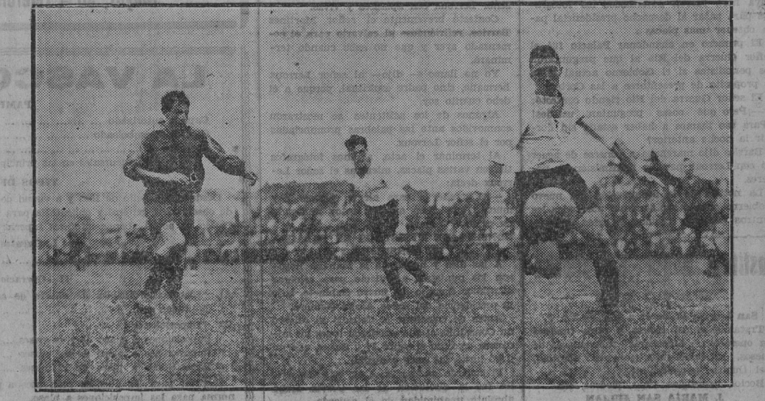
Vergara en otra interesante jugada del partido Irún-Osasuna.