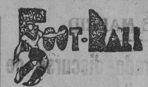
Los campeonatos regionales de fútbol