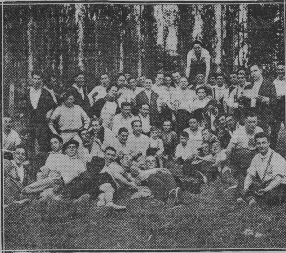
Socios de la Peña "Los Iruñehemes" que celebraron su jira anual a Iruzun, el domingo pasado. (Foto Rupérez).