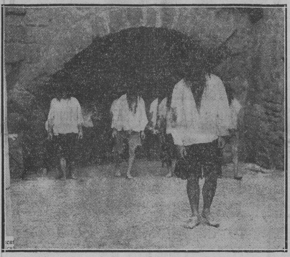
GUETARIA.—Desfile con que anualmente se conmemora y evoca el regreso, después de dar la vuelta al mundo, de Elkano. El insigne marino llega a San Salvador para dar gracias a Dios por el triunfo.