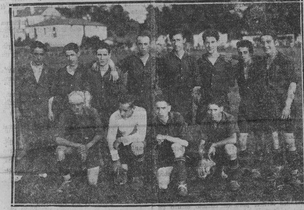
Los "mocés" del Osasuna que tan lucido y hermoso partido hicieron el domingo jugando contra el Dena Zuri.