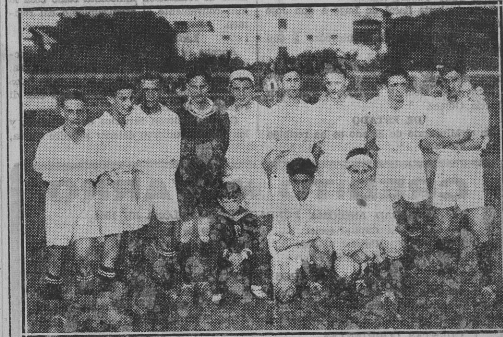
Los "chicos" del Dena Zuri que tan brillante papel hicieron anteayer en la lucha con sus rivales "Osasuna".

Una verdadera final, con todos los honores de tal, fué la que el domingo se disputaron los infantiles de Osasuna y el Dena Zuri.