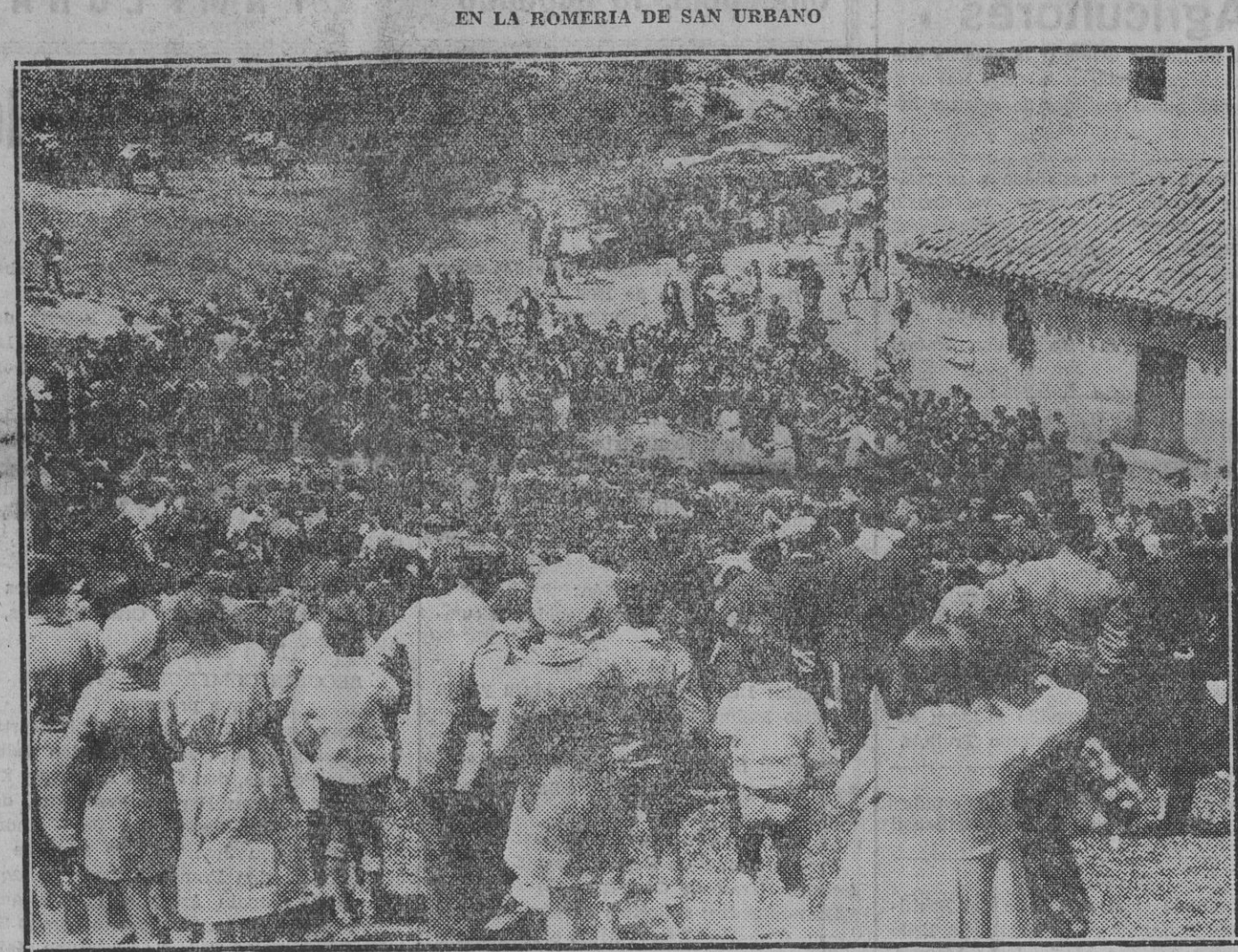
Un cuadro de "ezpatadantzaris" de Ezkuz-otxa de Pamplona ejecutando danzas vascas en Gascue ante la admiración y con el aplauso de los numerosos "romeros" de San Urbano

ne muchísimo menos que los Fueros— los diputados católicos españoles, guiados por sus órganos periodísticos más destacados, "A B C" y "El Debate".