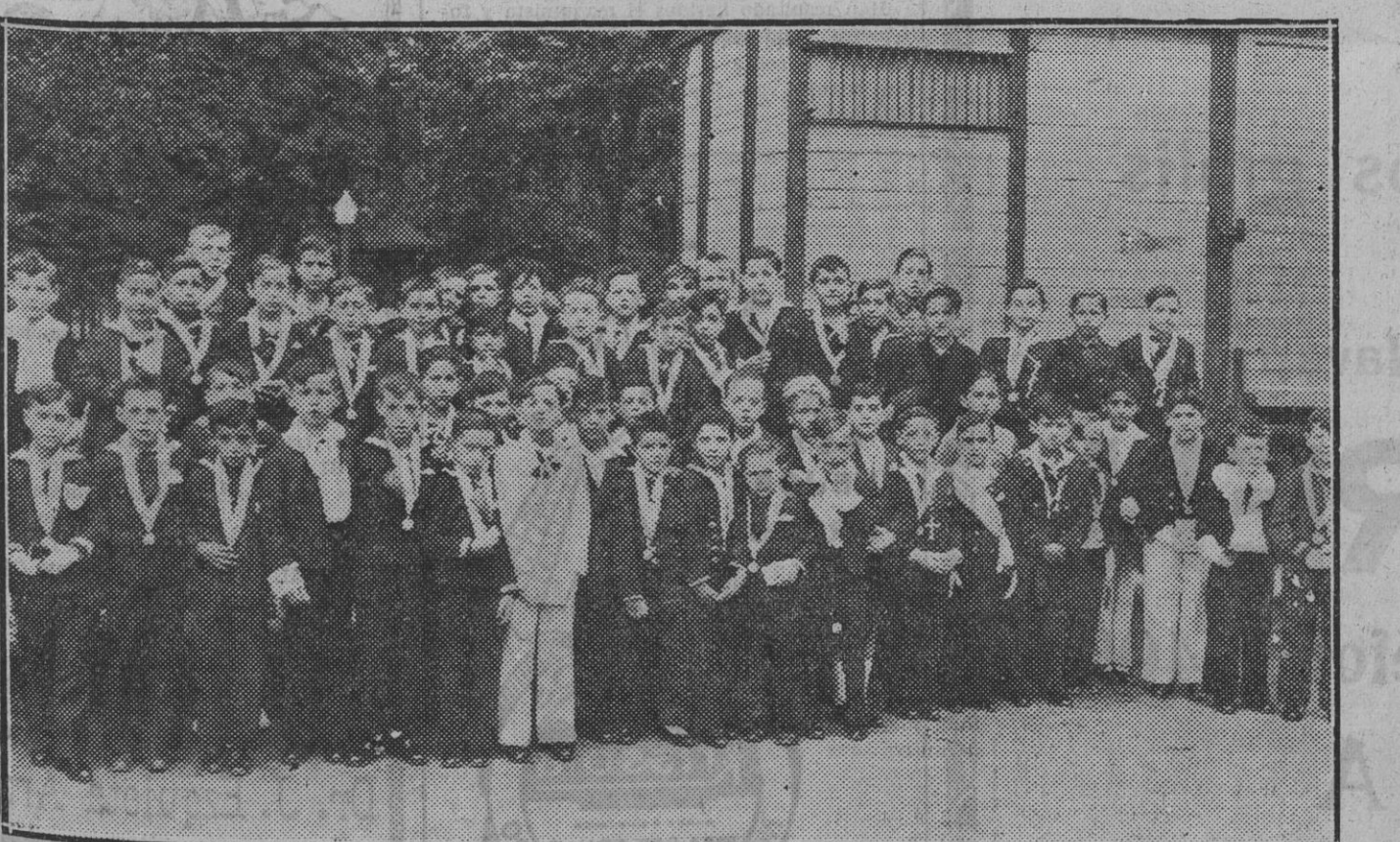
Grupo de niños de primera Comunión que ingresaron ayer en la Congregación de San Estanislao de Kostka, después de la imposición de la medalla de la Congregación