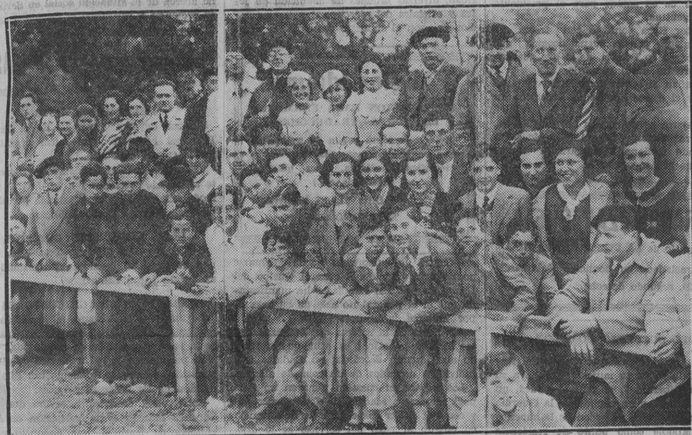
Un aspecto del campo de San Juan durante el partido del domingo entre el Osasuna y el Deportivo de la Coruña.

PARTIDO DE COPA AMATEUR DE ESPAÑA INDARRA-ESPAÑOL DE ZARAGOZA Ha correspondido en el sorteo de la primera eliminatoria de la Copa Amateur de España eliminarse al Indarra de Pamplona con el Español de Zaragoza, en Pamplona. Este encuentro tendrá lugar en el campo de San Juan el próximo domingo, a las cuatro y media de la tarde, durante su celebración se dará a conocer al público que en dicho campo de San Juan se reuna la marcha del encuentro D. Coruña-Osasuna, en La Coruña. Precederá a este encuentro un partido del torneo infantil entre el L. Eslava y el Juventud C. si es que la Federación acuerda repetir el encuentro que estos Clubs jugaron ya, pero que está pendiente de fallo de la Regional Navarra. Caso de no repetirse este encuentro se jugará un partido entre el L. Eslava y el Juvenil. No está mal la jornada futbolera de San Juan para el próximo domingo, máxime si recibimos buenas noticias de La Coruña como es de esperar. Desde luego yo me sé que los gallegos no las tienen todas consigo. Mucho hueso el Osasuna, en la forma actual para cualquier equipo "as" de España.