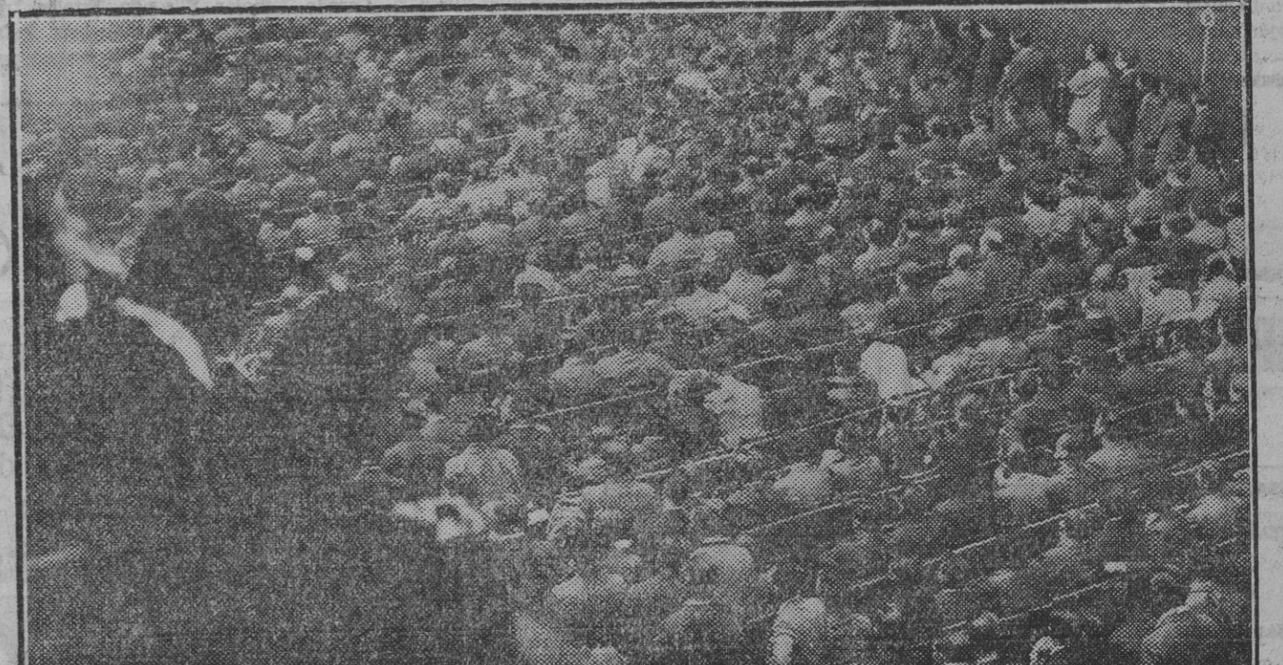
Aspecto parcial de la concurrencia que asistió al mitin de Solidaridad de T. V. en el Euskal Jal