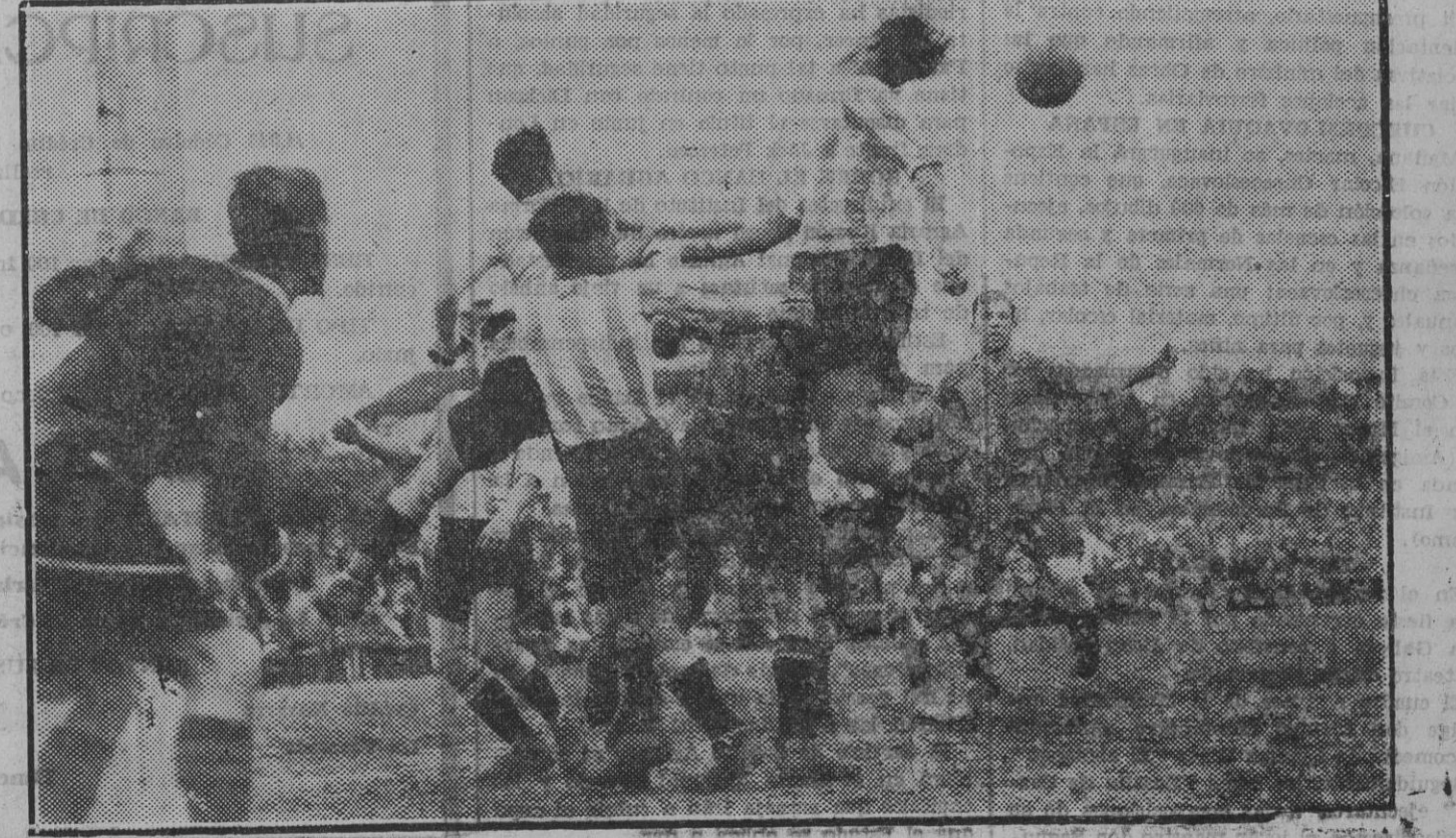
Corner contra el Deportivo tras el cual viene enseguida el primer goal de Osasuna