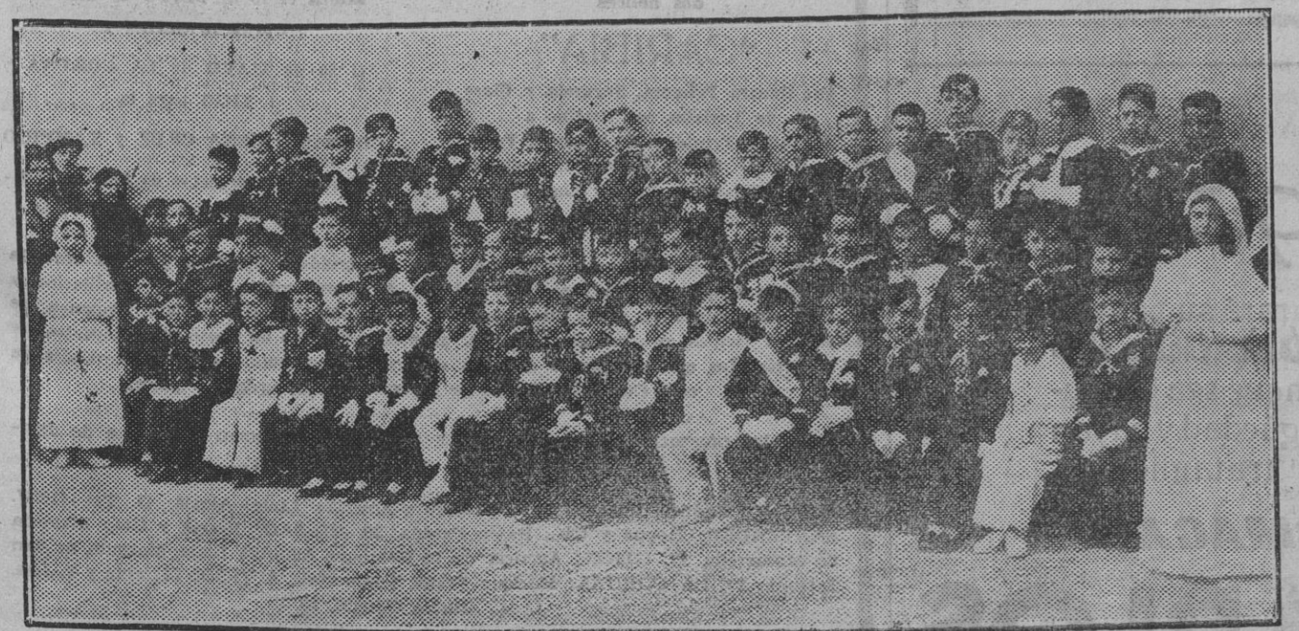
Un grupo encantador de los niños del Colegio de los PP. Escolapios de esta ciudad que el domingo tuvieron el felicísimo día de su primera comunión

Cita varias leyes dadas por nuestras Cortes en 1794, en las que se reconoce expresamente la nobleza de la profesión de diversos oficios, y termina demostrando con gran elocuencia, con argumentos perfectamente susorrios que lo que ahora se pre-