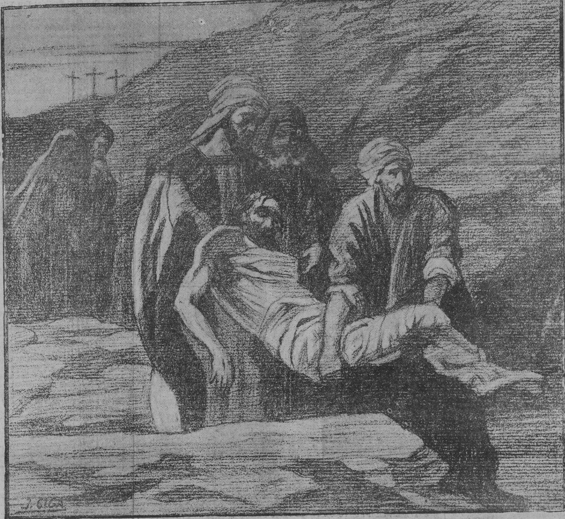
El entierro de Jesús, (admirable e inspirada composición de Giga)