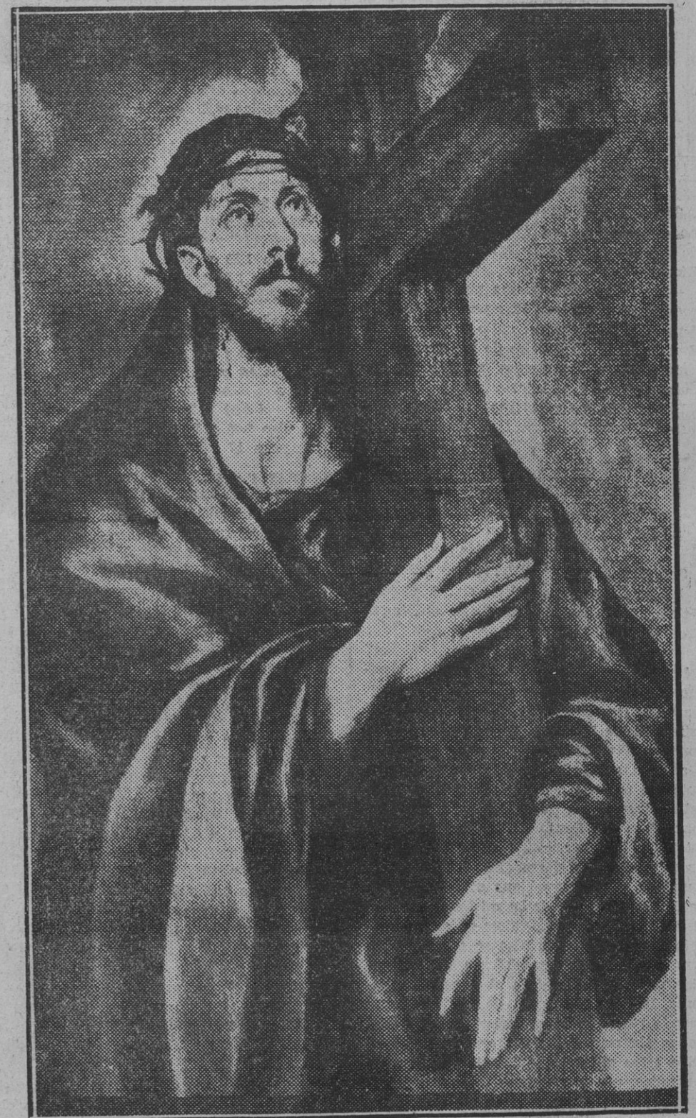
Jesús subiendo al Calvario con la Cruz, (cuadro del Greco)

Observaciones importantes e información del viaje a Donostia, en el centro de la segunda página.