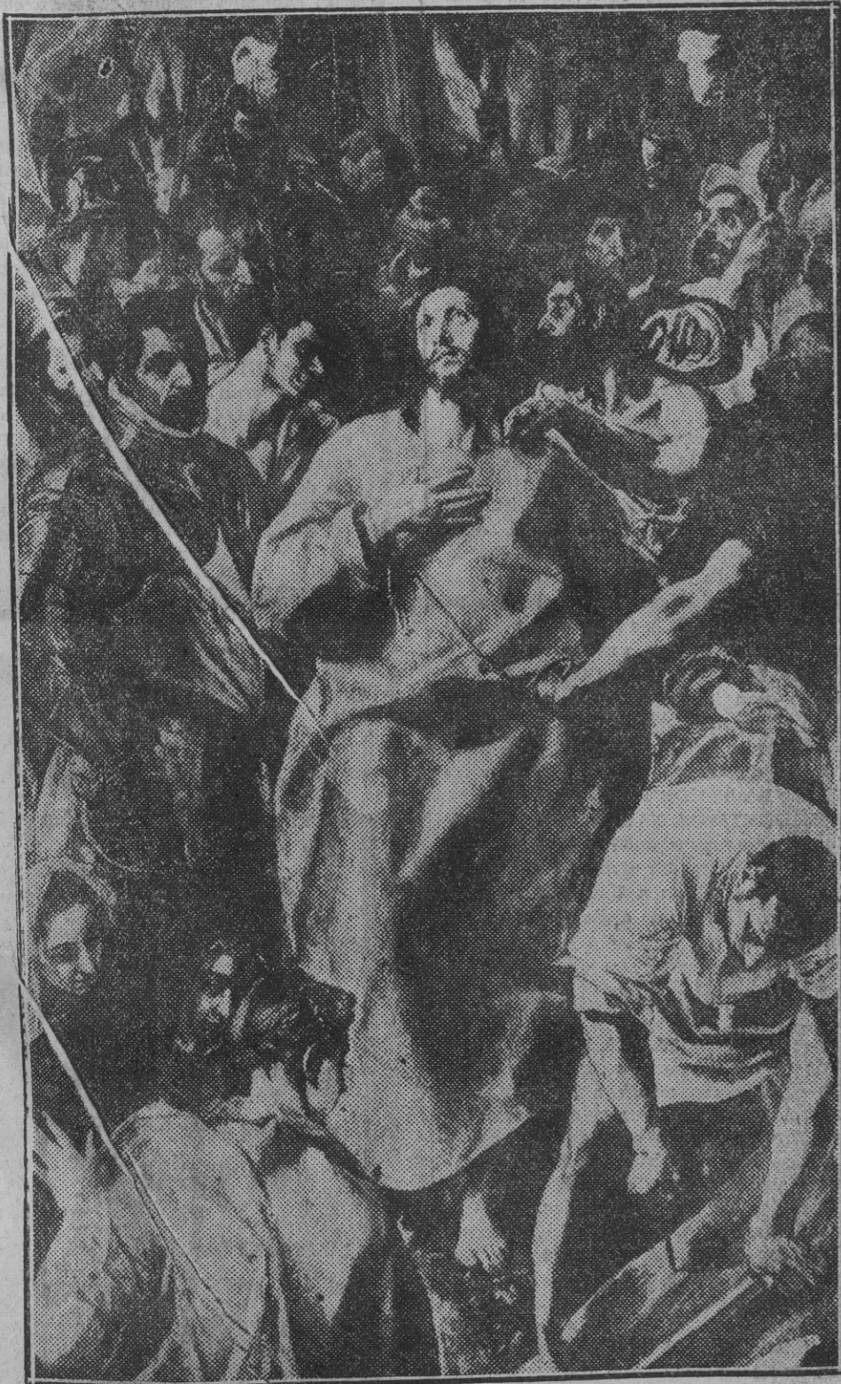
El Redentor en la cumbre del Calvario ante la Cruz, (cuadro del Greco)