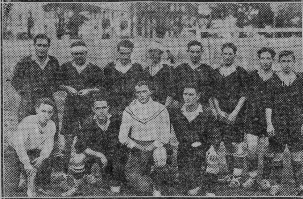
El equipo del Alkertasuna, que tan rotundos triunfos, está obteniendo esta temporada, y el cual el domingo venció al Aurora por 3 a 1

LOGROÑO. — El campo de Las Gaudas se vió bastante animado de público para presenciar el partido Logroño-Tolosa. El equipo riojano hizo un mal partido;